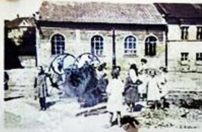
Synagoga Chewra Lomdej Mishnajot, ok. 1939 | The Chevra Lomdei Mishnayot Synagogue, c. 1939