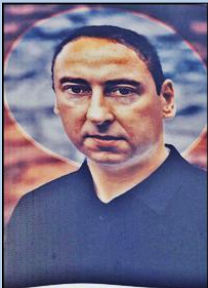
Św. Stanisław Kostka