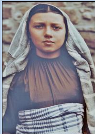
Św. Hiacynta Marto