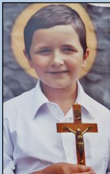
Św. Dominik Savio