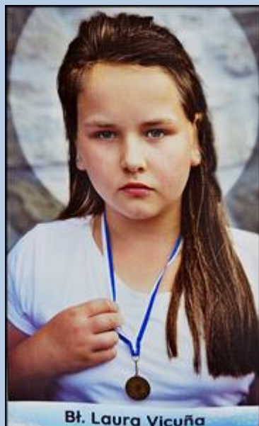
Bł. Laura Vicuña