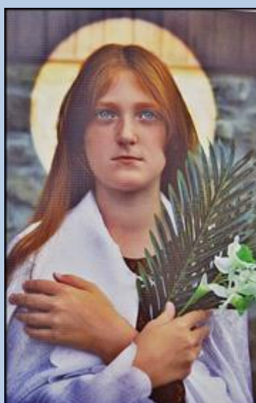
Św. Maria Goretti