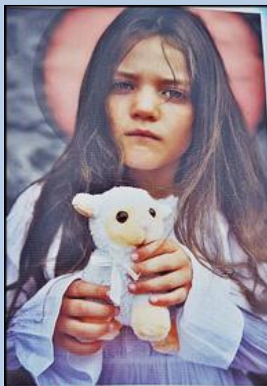
Św. Agnieszka Rzymianka