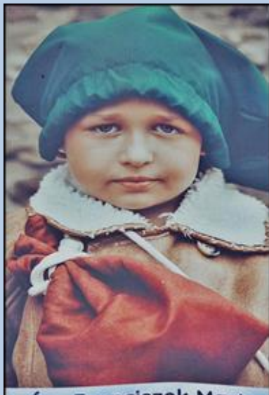
Św. Franciszek Marto