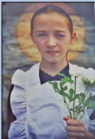
Bł. Karolina Kózkówna