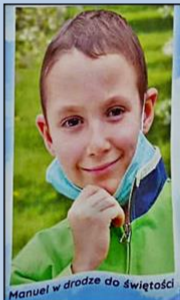
Manuel w drodze do świętości