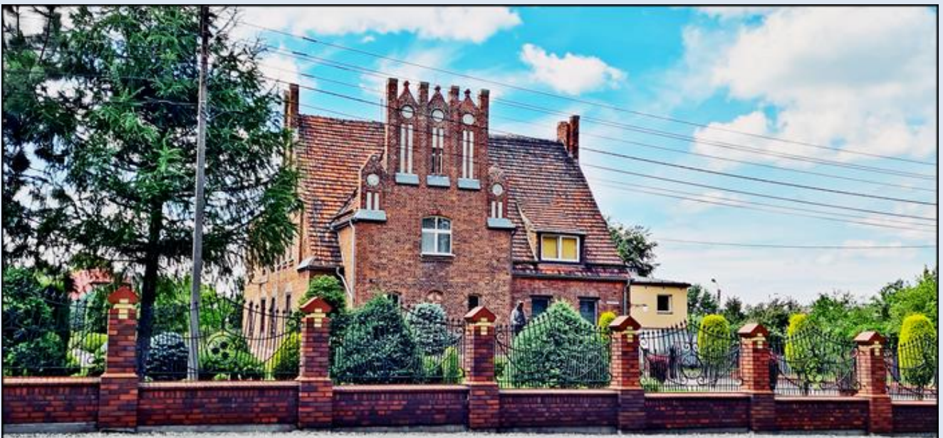
naprzeciw kościoła plebania z figurą Chrystusa Króla