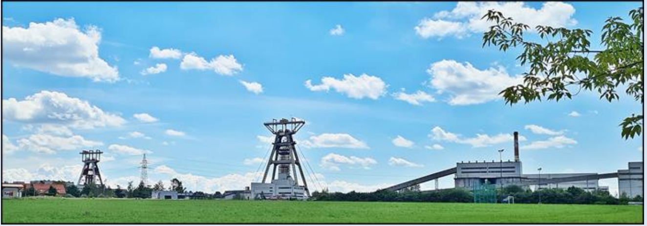
Po prawej stronie od kościoła znajduje się KWK 'Budryk' – naprzeciw niej św. Barbara