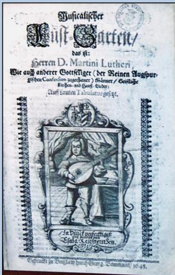
Strona tytułowa Musikalischer Lust-Garten , na której widnieje portret Esaiasa Reusnera Starszego

Kto się tylko na Boga zdaje - pięćdziesiątka, Kancjonał, Brzeg 1880, s. 10.