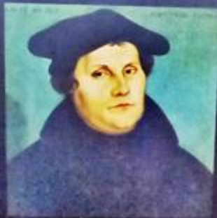
Portret Marcina Lutra, aut. Lucas Cranach Starszy, 1529 r.

Marcin Luter urodził się 10 listopada 1483 roku w Eisleben. Po odbyciu edukacji w szkole miejskiej w Mansfeld, szkole katodralnej w Magdeburgu i szkole klaszornej oo. franciszkanów w Eisenach, w 1501 roku rozpoczął studia na uniwersytecie w Erfurcie, początkowo na wydziale nauk wyzwolonych, które ukończył w styczniu 1505 roku jako magister filozofii. Kontynuował naukę na wydziale prawa, jednak przerwał studia, by 17 lipca 1505 roku wstąpić do zakonu augustianów. Po odbyciu postuluatu i nowicjatu 4 kwietnia 1507 roku przyjął w Erfurcie święcenia kapłańskie, a uroczystość pomyślnie odbyła się 2 maja. W 1508 roku został przeniesiony do klasztoru w Wittenberdze, gdzie objął stanowisko wykładowcy filozofii moralnej na nowo założonym uniwersytecie i jednocześnie kontynuował studia teologiczne. Tam uzyskał tytuł bakałarza Pisma Świętego oraz sancerzjarłona, uprawniający do wykładania Schemata Petrus Lombarda. W październiku 1510 roku wyjechał do Ratisny. Po powrocie udał się do Wittenberga, by objąć w nowo założonym uniwersytecie stanowisko profesora apogorey teologicznej i zaczął pisać i wygłaszać wykłady o teologii Pisma Świętego oraz krytycyzmem wykładem ich sensu.