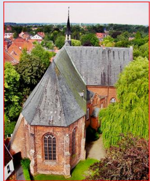
zdjęcia i opis: L.P.

zdjęcia w czerwonym obramowaniu zapożyczono z: https://weener.reformiert.de/startseite.html