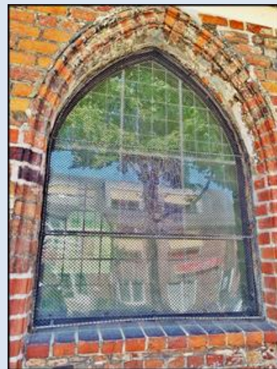
zdjęcia i opis: L.P.