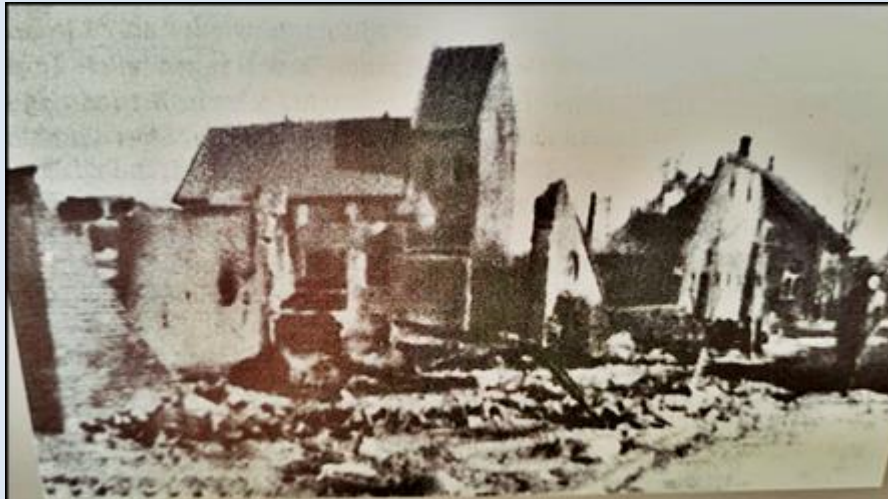
Die „Alte Kirche“ im kriegs- zerstörten Rhede, um 1945.