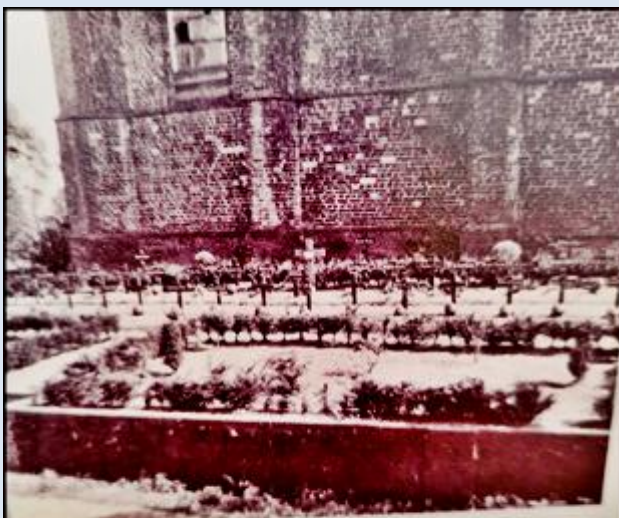
Die Kriegsgräberstätte an der Nordseite der „Alten Kirche“, um 1950.