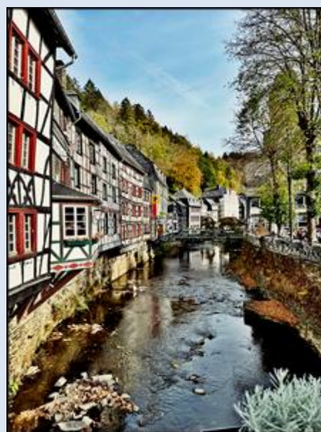
uzupełnienie z października 2022 r.