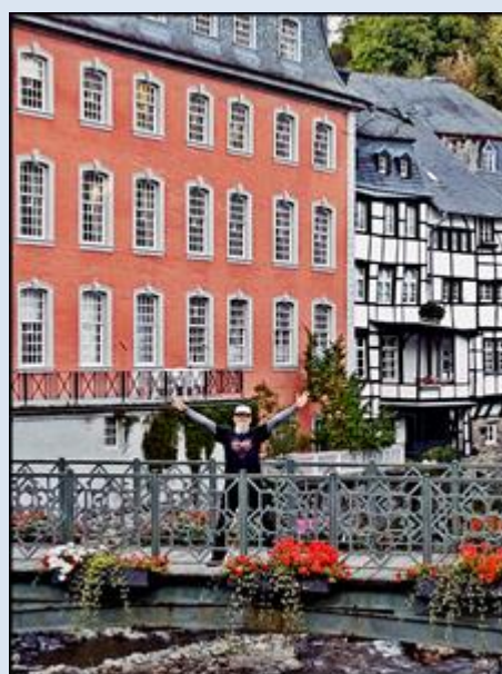
i rozdzielająca je rzeka Ruhra