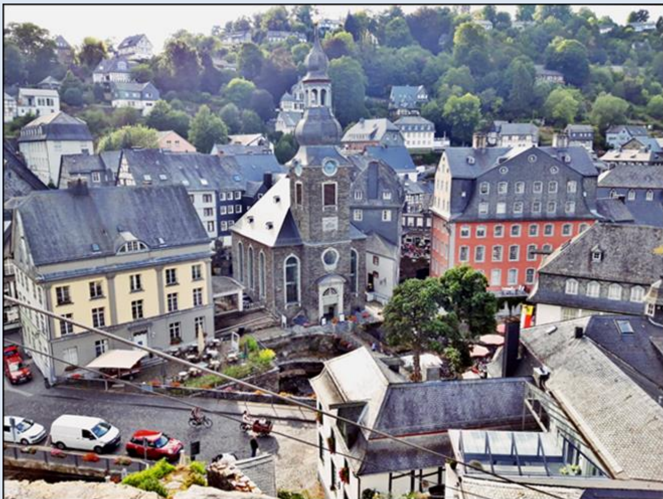
Widok na kościół ewangelicki z pozycji wieży Kościoła pw. Niepokalanego Poczęcia NMP