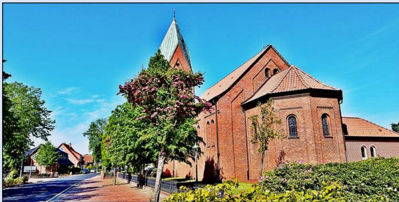
zdjęcia i opis: L.P.