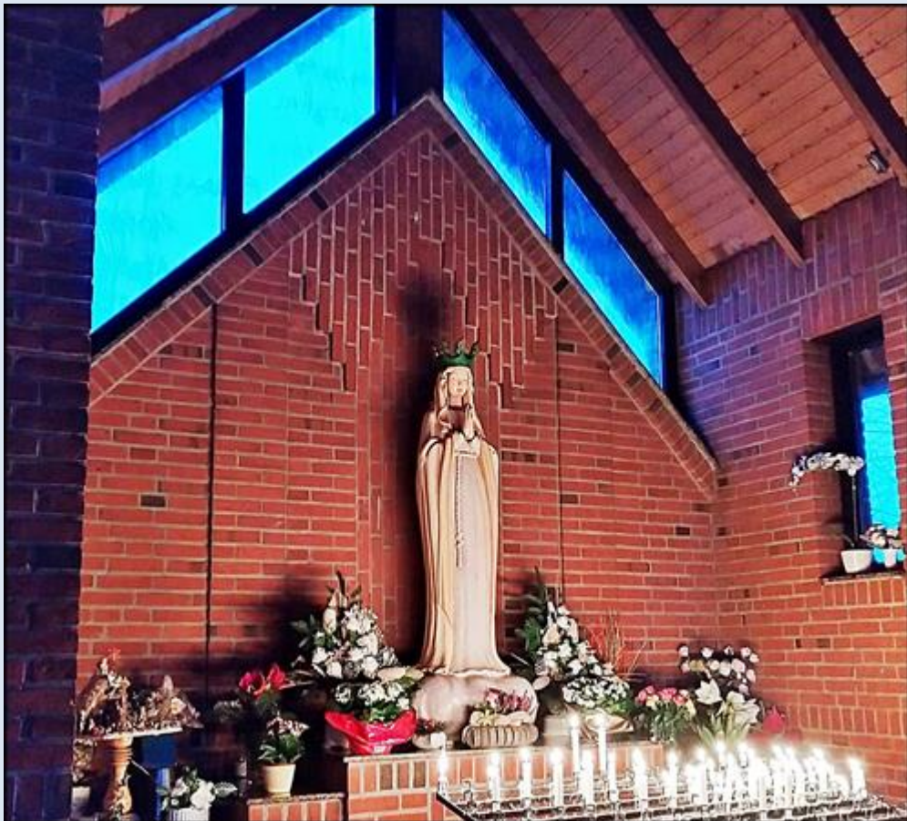
Kaplica 2: Königin der Armen Seelen (Królowej Ubogich Dusz)