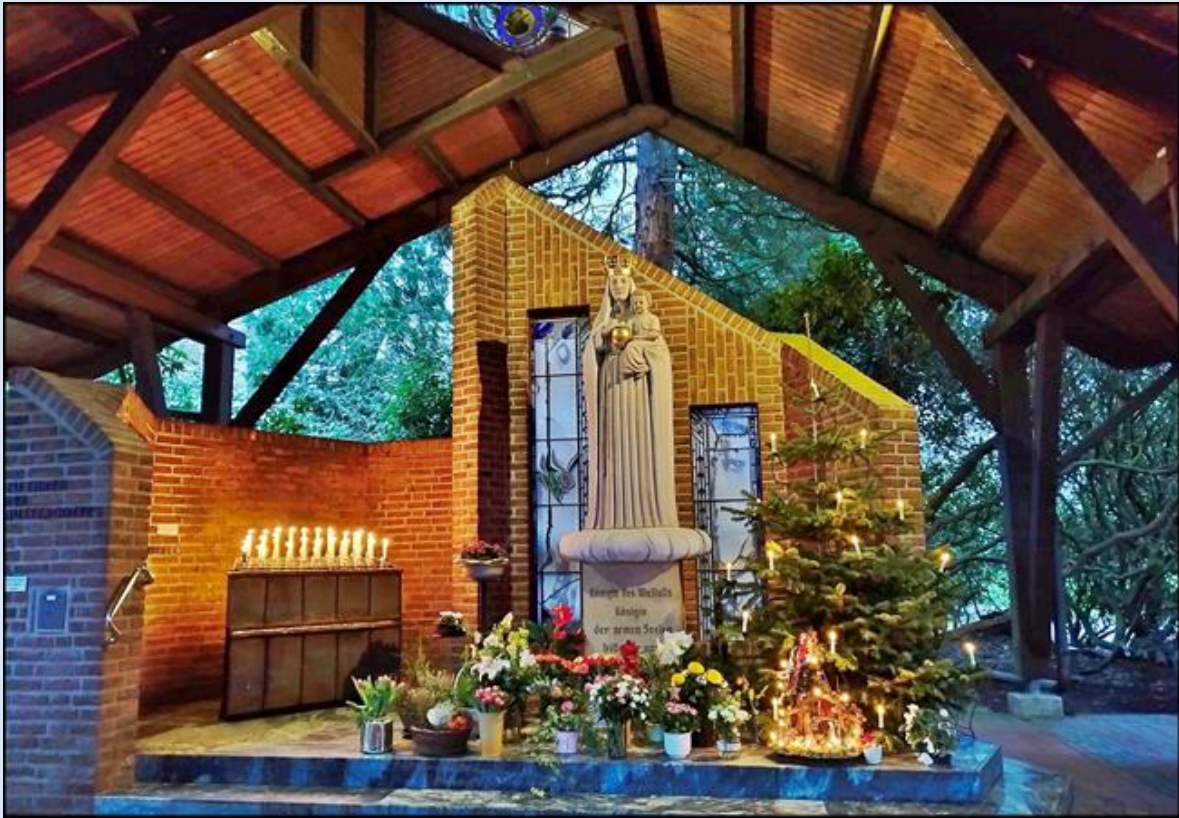
Kaplica: Maria, Königin des Weltalls (Maryi, Królowej Wszechświata)