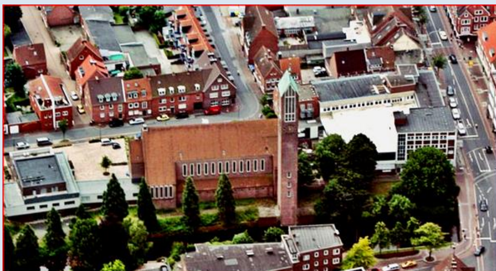
zdjęcia i opis: L.P.

zdjęcia w czerwonym obramowaniu zapożyczono z: https://www.google.com/url?sa=i&url=https%3A%2Fwww.youtube.com%2Fwatch%3Fv%3DaUBj4cBkltk&psig=AOvVaw1sZoFR0lvLJ5x7UX_VnEvg&ust=1691244038802000&source=images&cd=vfe&opi=89978449&ved=0CBQQ3YkBahcKEwjorsuUlcOAAxUAAAAHQAAAAAFg https://www.kirche-emden-leer.de/Archiv/2022/Tauf-Fest_mehrerer_Gemeinden/KKS_Emden_Leer_6_2022 https://www.martin-luther-gemeinde-emden.de/