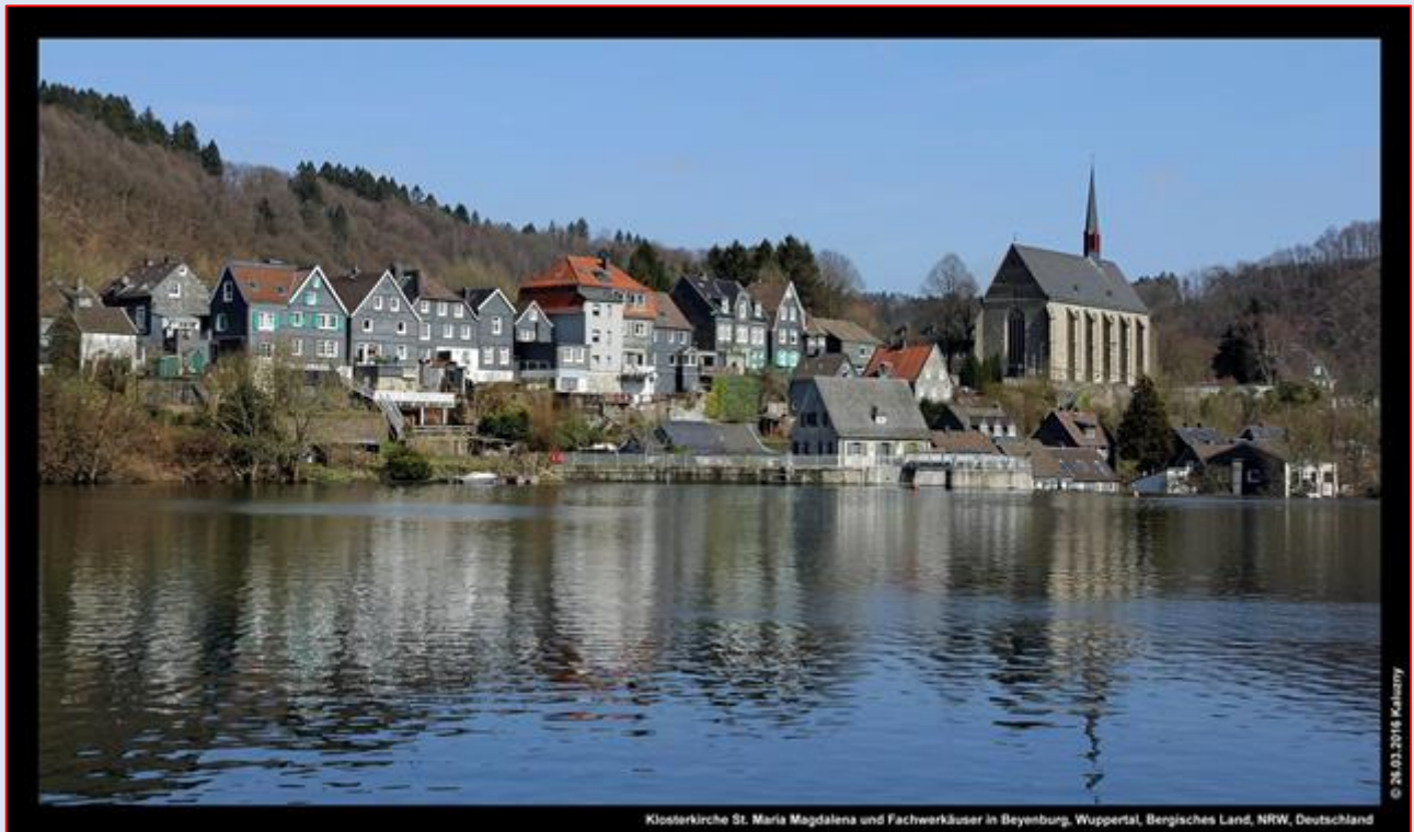
Klosterkirche St. Maria Magdalena und Fachwerkhäuser in Beyenburg, Wuppertal, Bergisches Land, NRW, Deutschland