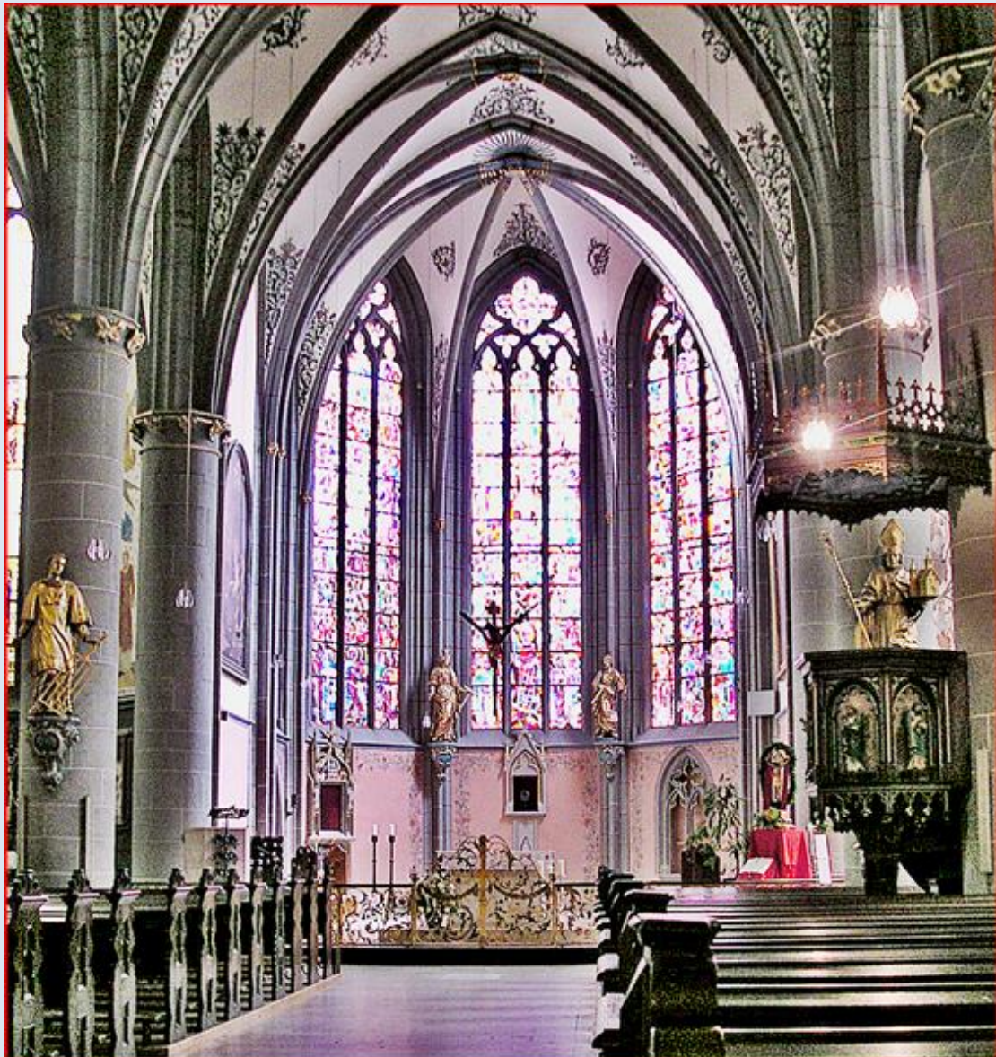
zdjęcie sprzed powodzi

https://www.dw.com/pl/jeszcze-wi%C4%99cej-ofiar-%C5%9Bmiertelnych-w-powiecie-ahrweiler/a-58296570