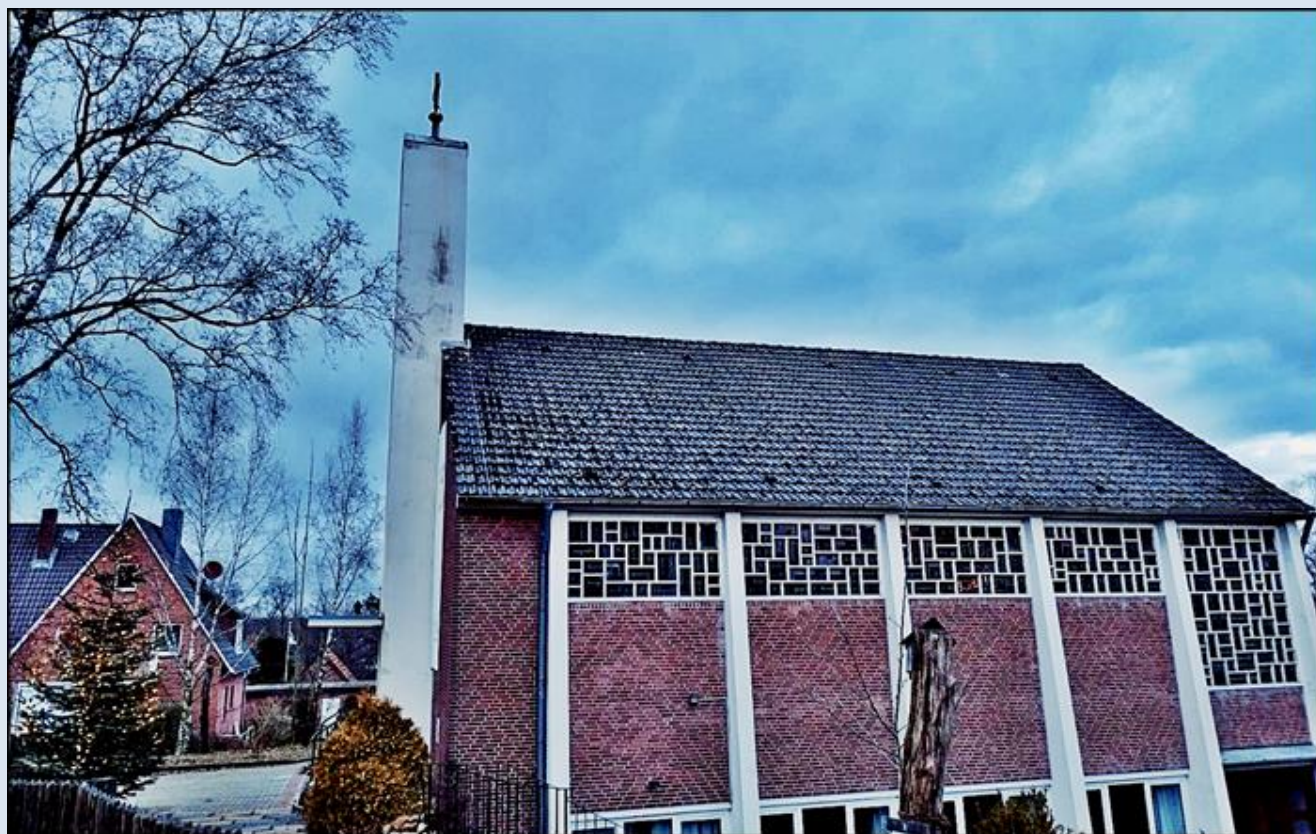
zdjęcia i opis: L.P.