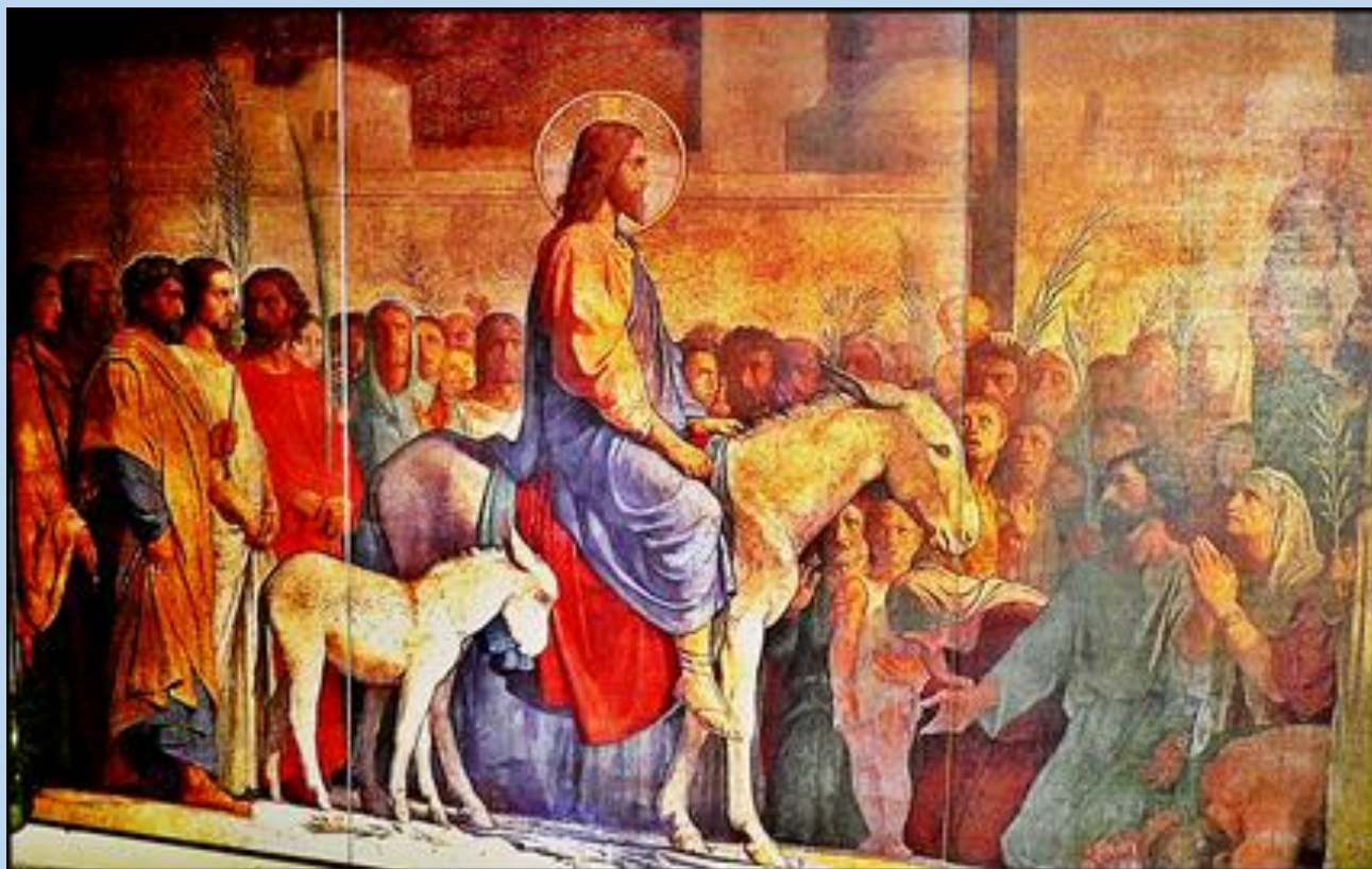
Święta Góra Przeprośna, Ko. Ośmiu Błogosławieństw