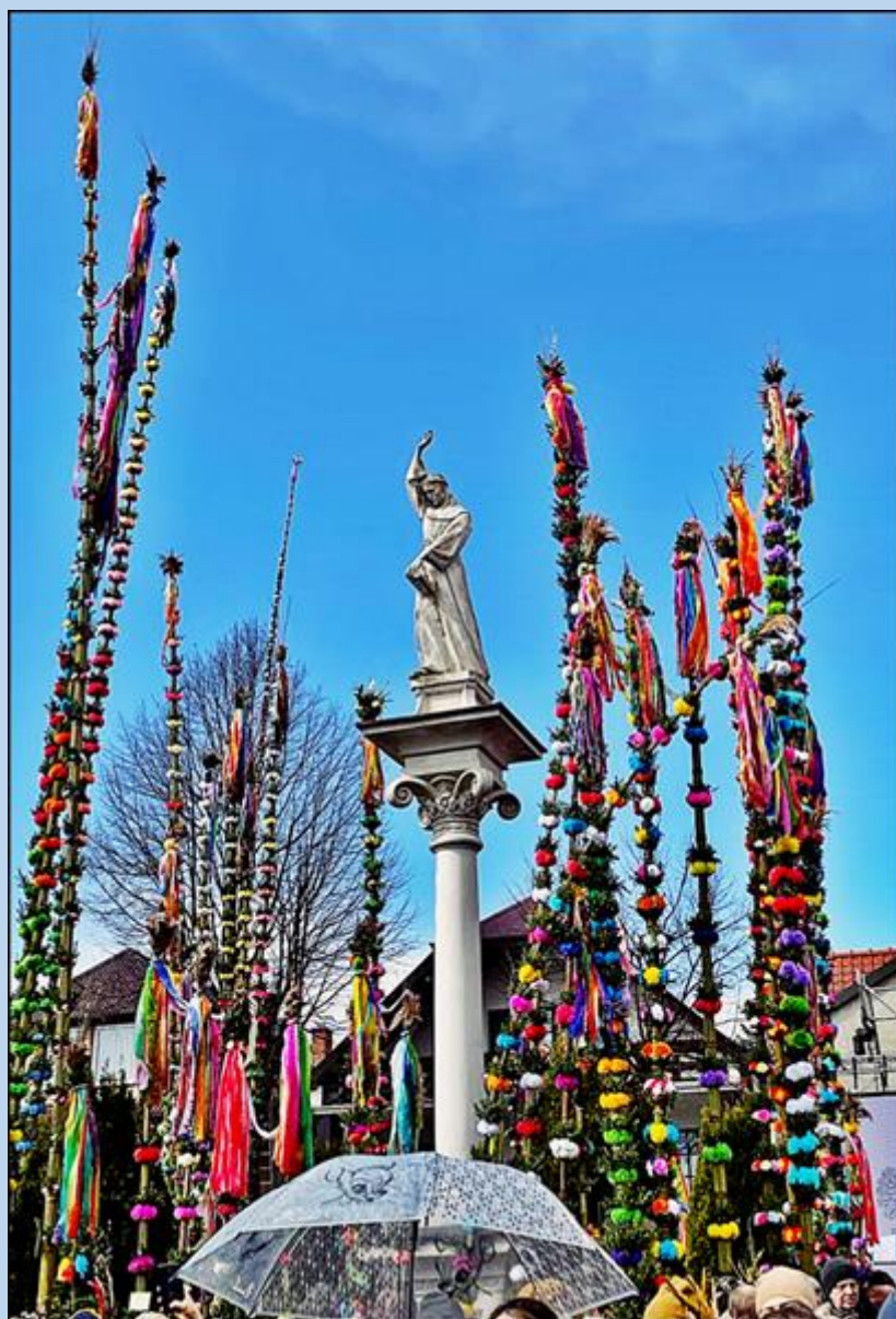
Lipnica Murowana (24.03.2024 -)