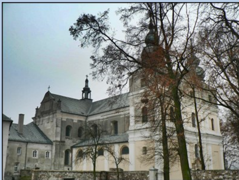
zdjęcie w czerwonej obwódce zapożyczono z: http://www.fluidi.pl/grafiki/0088/8889_P_519078947.jpg