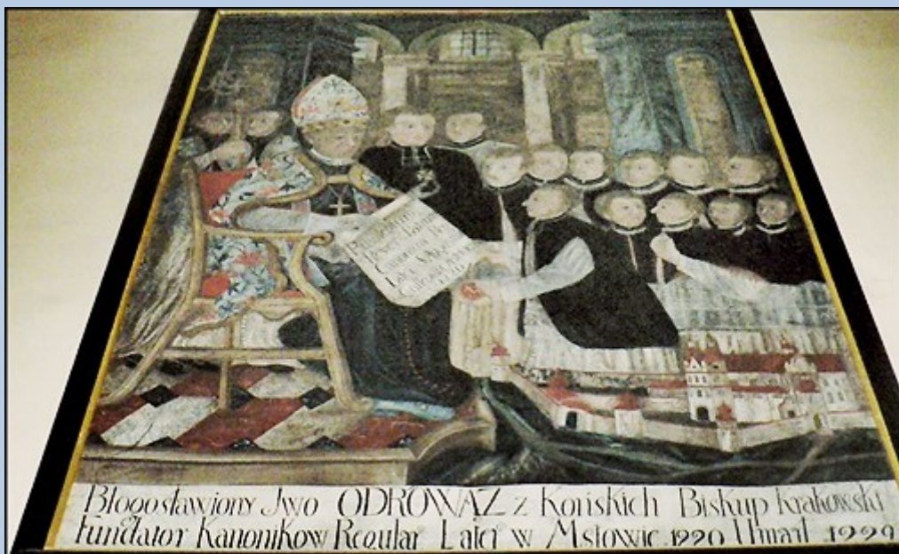
Błogosławiony Jęwo ODRONAZ z Koriskich Biskup krakowski fundator Kanoników Regulari Latci w Mstowie 1220 Umrł 1299