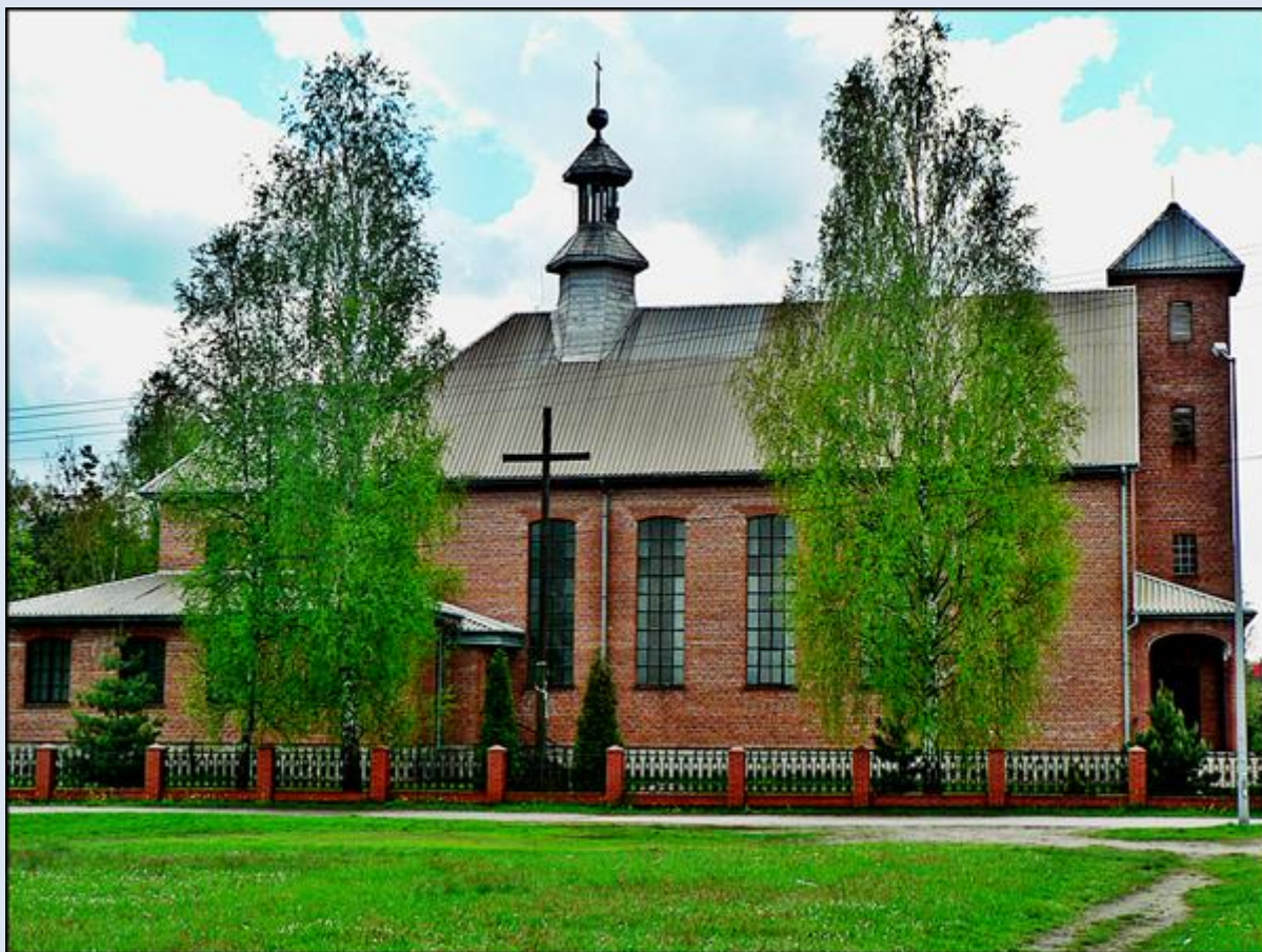
Parafia pw. św. Rocha, nowy kościół