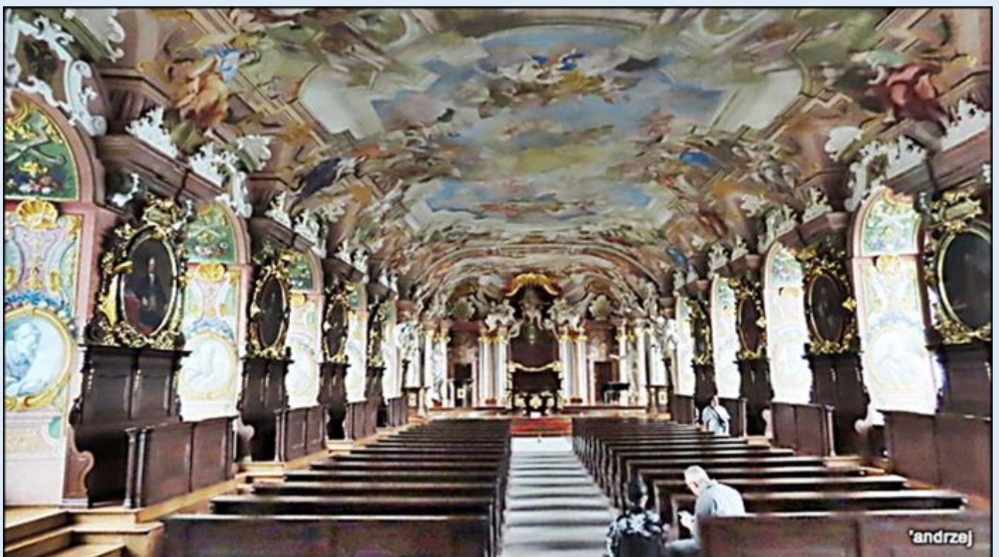
Aula Leopoldina w gmachu głównym Uniwersytetu Wrocławskiego