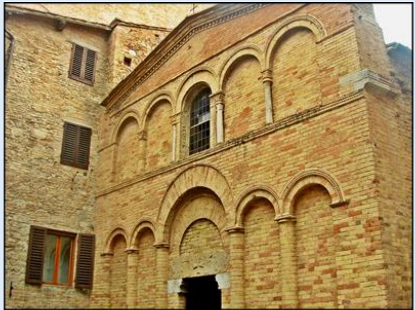
zob. Kościół św. Augustyna