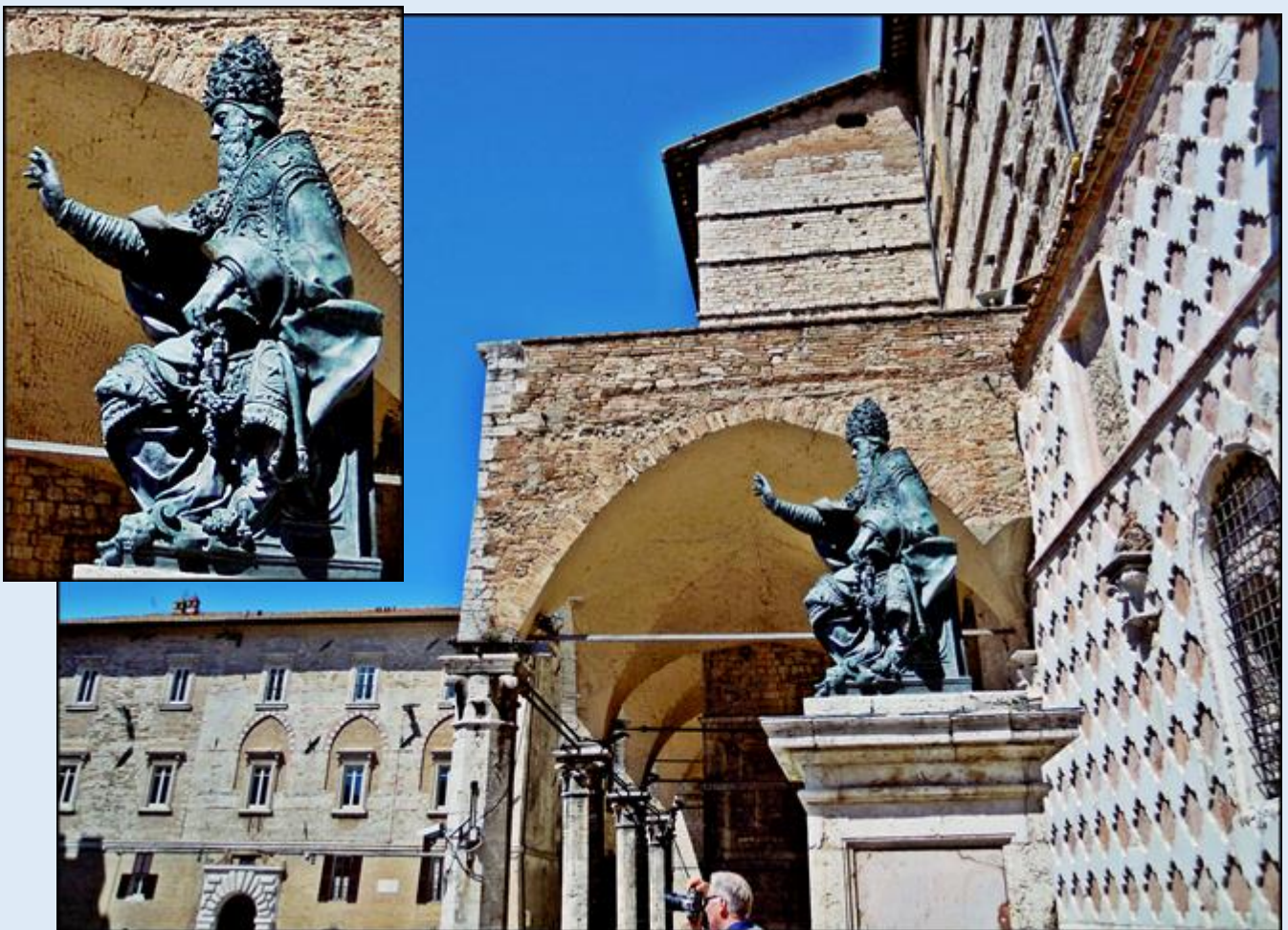
Posąg papieża Juliusza III, Który błogosławi przed Katedry św. Wawrzyńca w kierunku Fontanny Maggiore