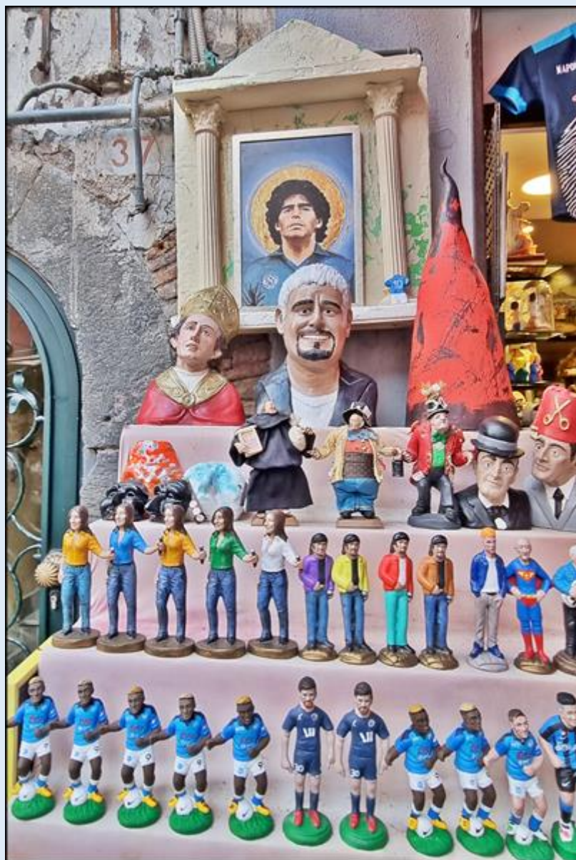
Maradona jako święty