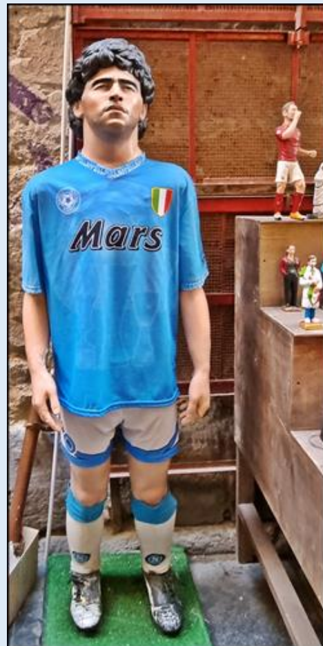
Maradona jest bardzo cenionym eksponatem