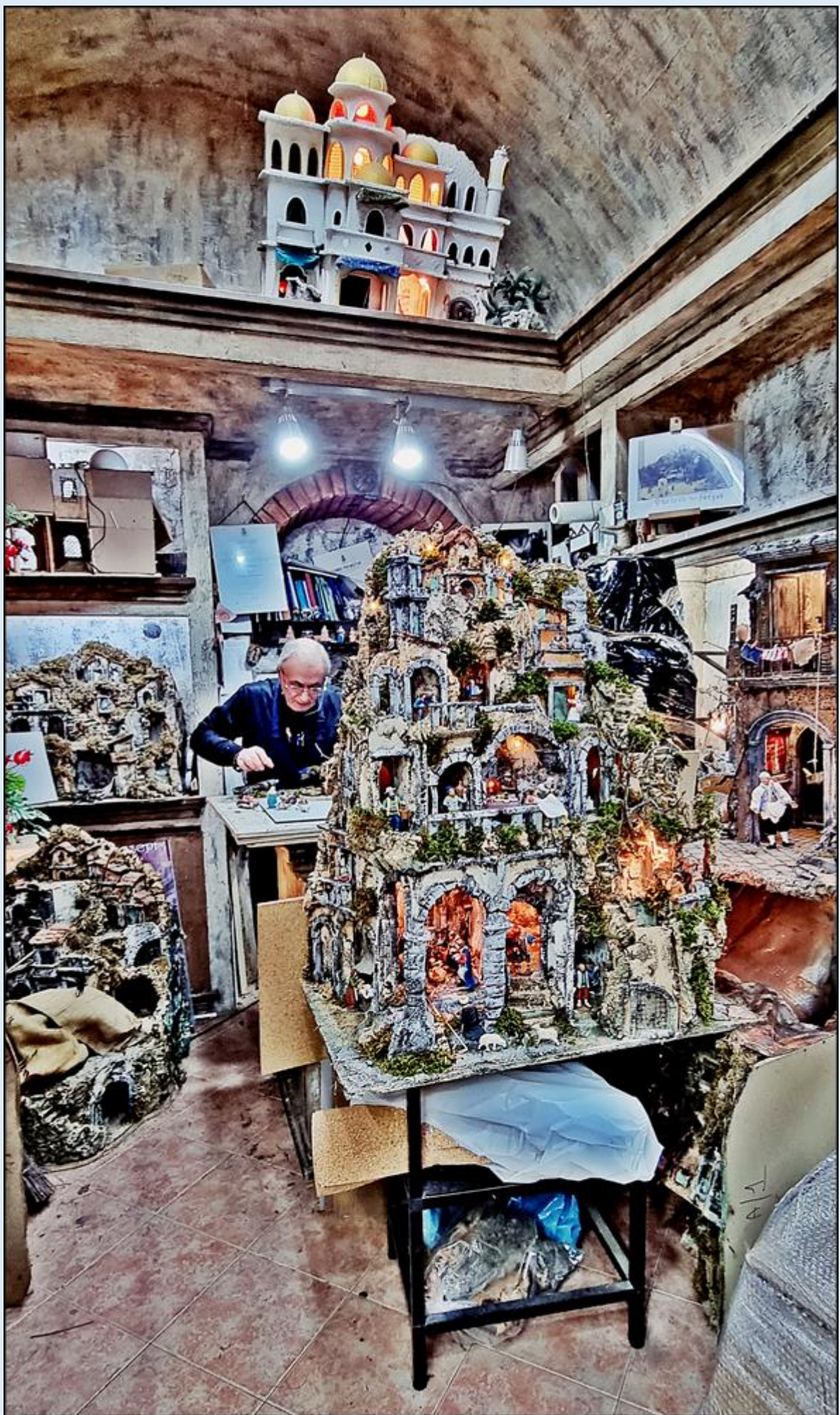
szopki wykonywane są ręcznie na oczach zainteresowanych