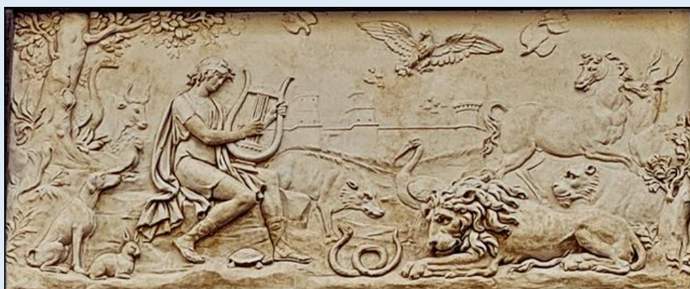
Orfeusz gra na lirze zachwyconym zwierzętom