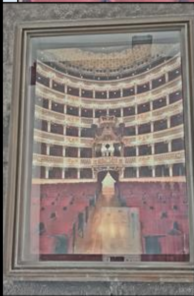
repertuar z 30.11.2022 r.