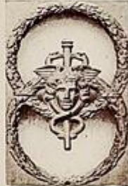
Particolare in bronzo

Il teatro di S. Carlo sorge nel 1737 per volontà di Carlo di Borbone - al trono da tre anni - ad opera di Angelo Cavasale, su progetto di Antonio Medrano. È inaugurato il 4 novembre - giorno dell'onomastico del re - con l'opera "Achille in Sciro", del Metastasio, musicata da Domenico Sarro.