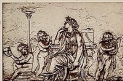
Rilievi in stucco