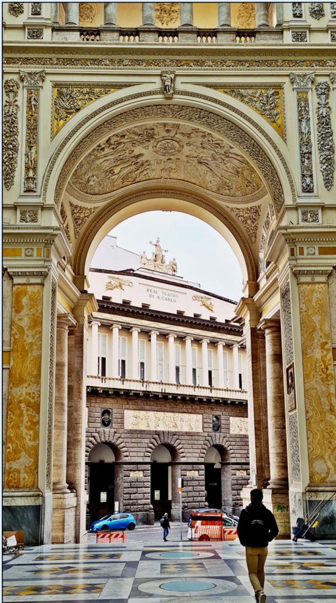
widok na Teatr Królewski od strony Galerii Umberto I