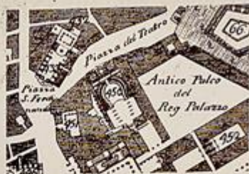
G. Carata duca di Noja - Mappa topografica della città di Napoli - 1775 (particolare)