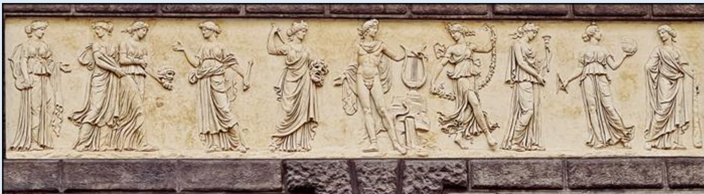
nad głównym wejściem płaskorzeźba z Apollonem i Muzami