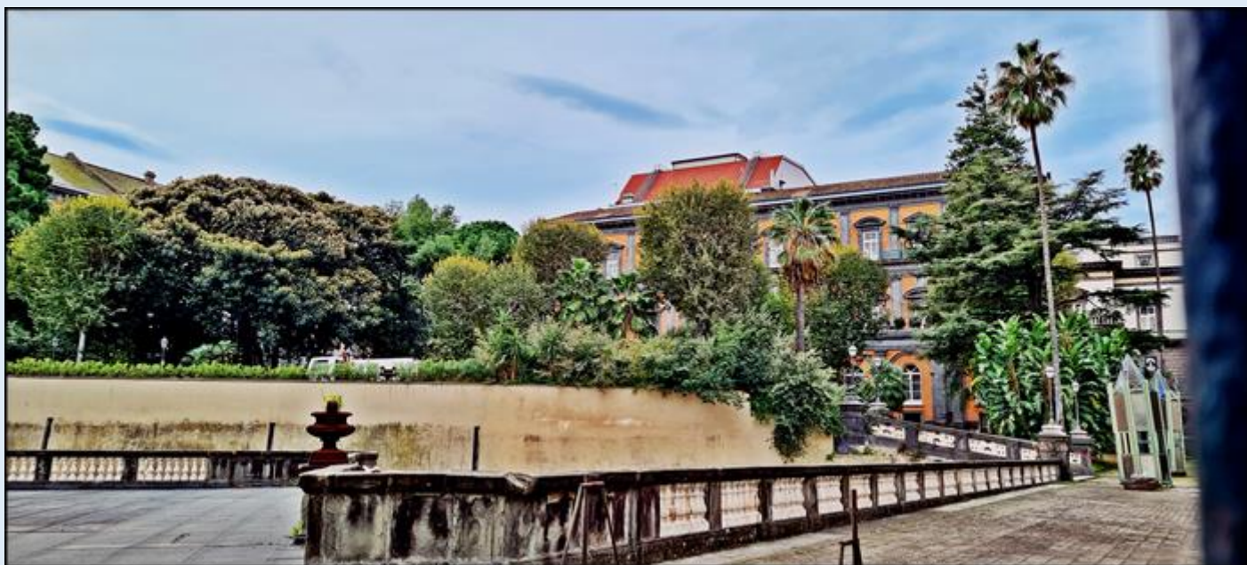
Teatr San Carlo od strony wschodniej

zdjęcia w czarnej obwódce: pw zdjęcia w zielonej obwódce: tsw