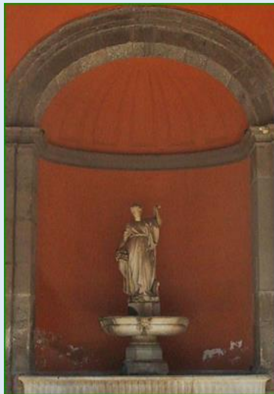
fragment ściany zachodniej przy Pałacu Królewskim