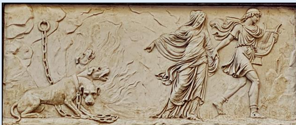
Orfeusz wyprowadza Eurydykę z Hadesu