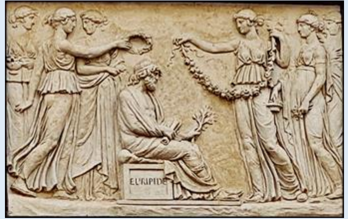
Sofokles i Eurypides – główni dramatopisarze starożytnej Grecji