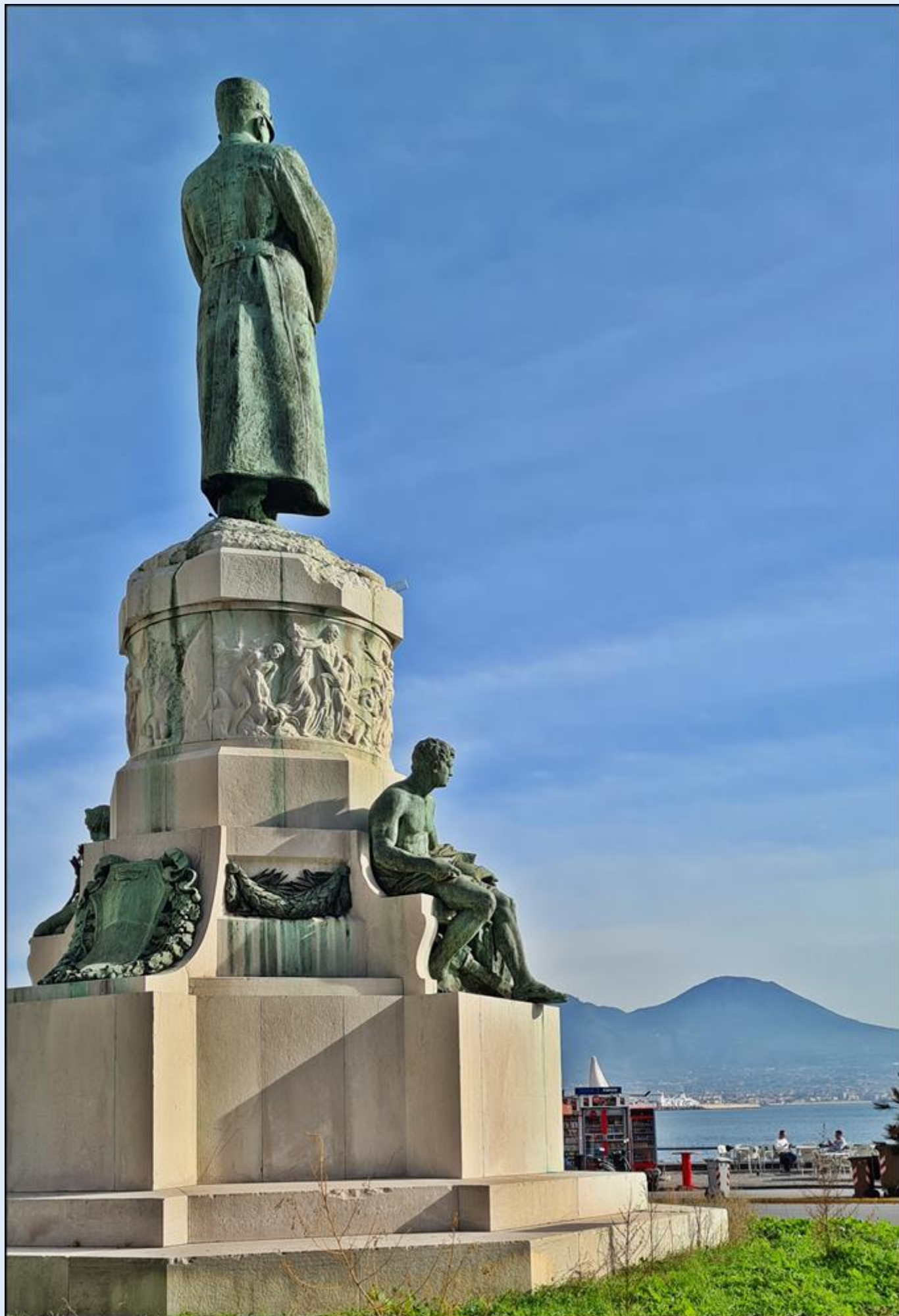
król wpatrzony w morze i Wezuwiusz