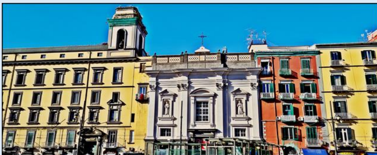
Widok naprzeciw Narodowego Konwiktu Wiktora Emanuela – w centrum Kościół św. Dominika Soriano