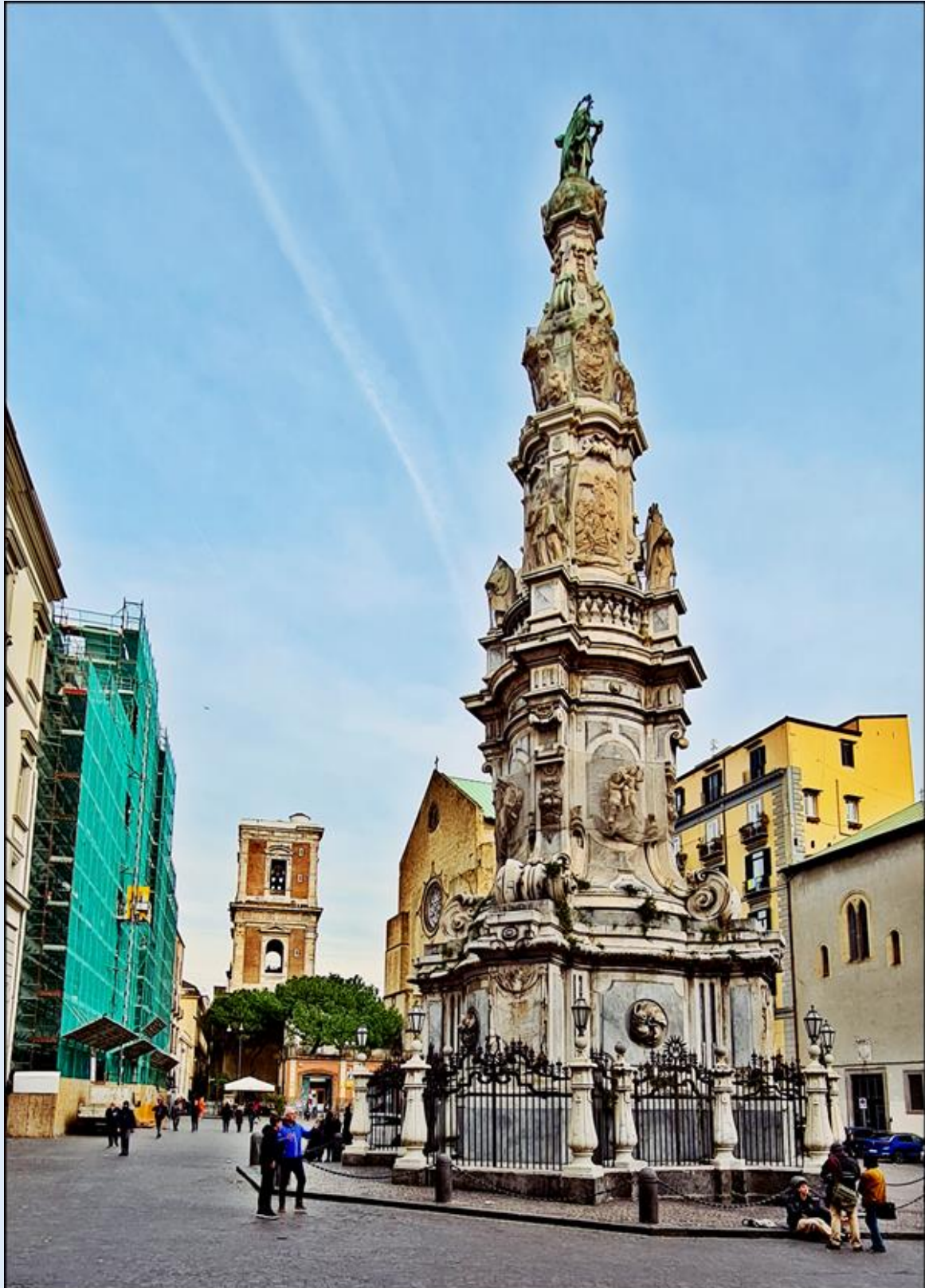
Obelisk MB Niepokalanie Poczętej: z lewej w remoncie: fasada Kościoła Gesù Nuovo dalej: dzwonnica Bazyliki Santa Chiara i Basilica di Santa Chiara