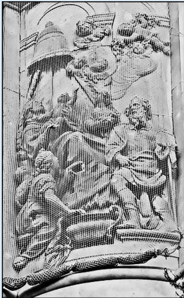
ZWIASTOWANIE – NARODZENIE JEZUSA