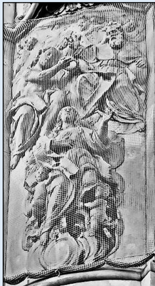
OFIAROWANIE W ŚWIĄTYNI – WNIEBOWZIĘCIE I UKORONOWANIE