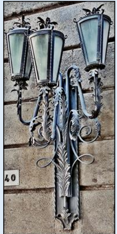
latarnie pięknie zdobione ... i Maradona (grał w Napoli) uznawany za świętego