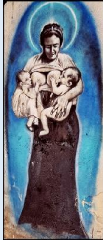
kapliczki święte i jakieś dziwne...