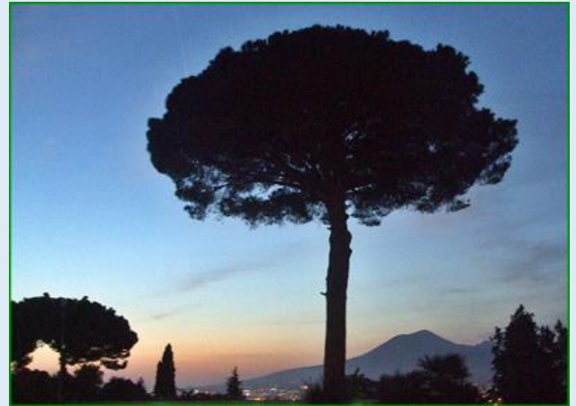
na targu... porą wieczorną...