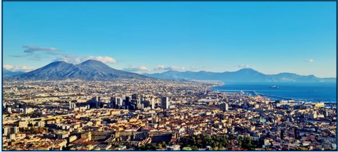
widok na Wezuwiusz z samolotu