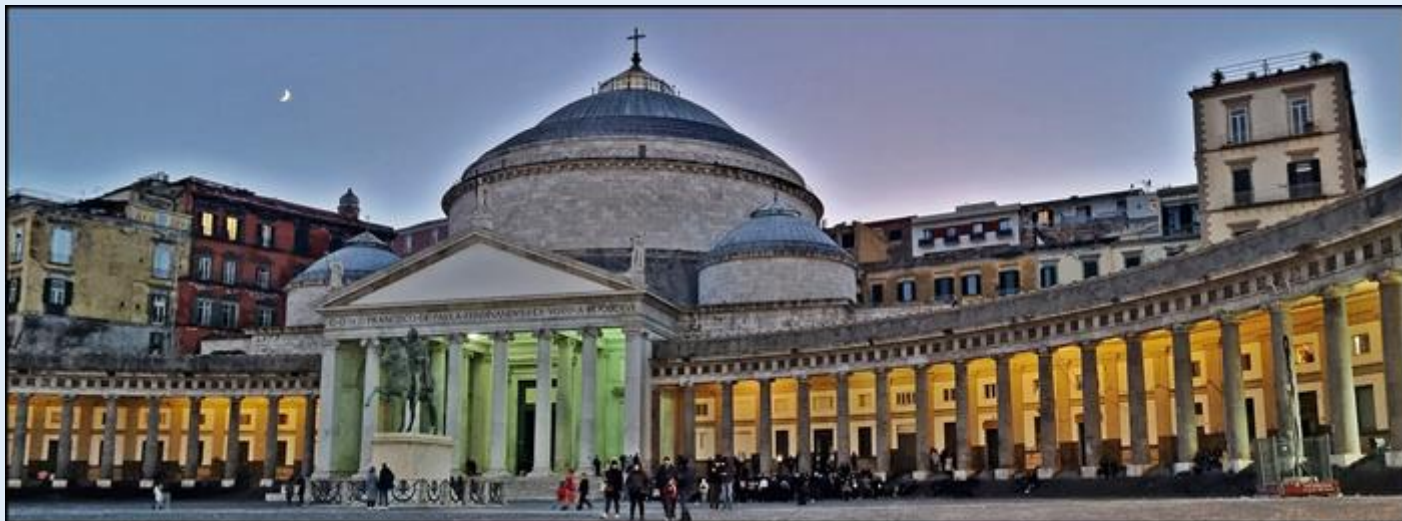
wspaniałe zabytki kościelne: p. Kościoły Neapolu