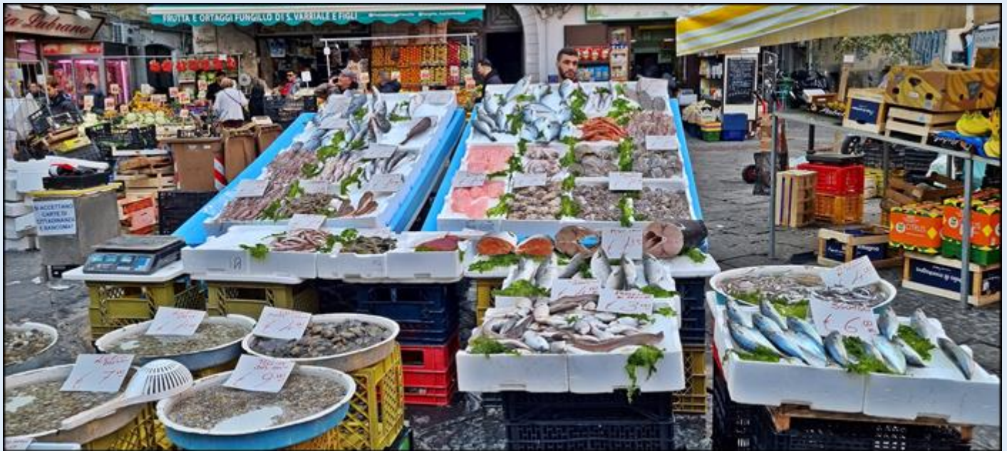
ryby prosto z morza...