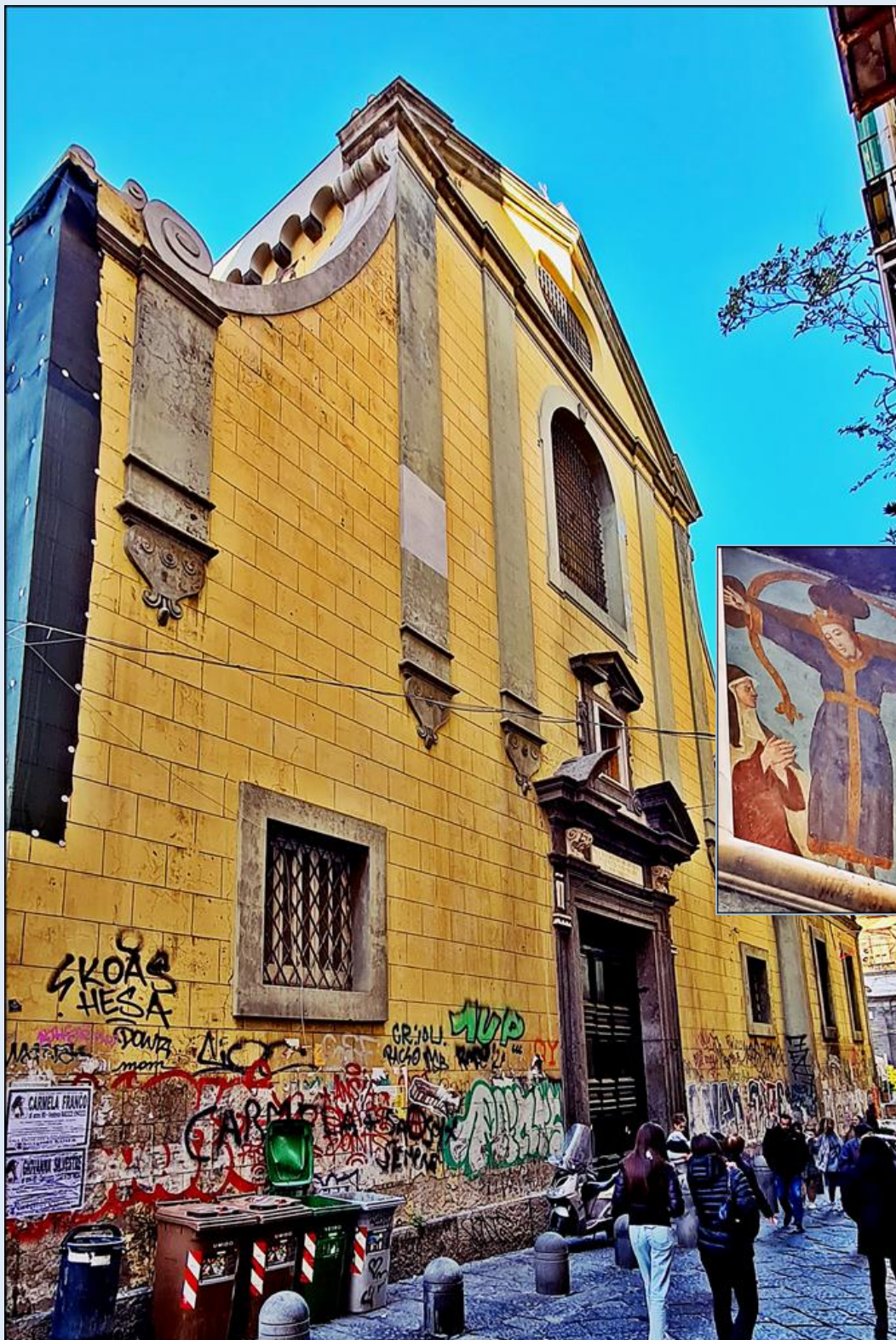
Są też pobazgrane świątynie, może dekonsekwowane, ale jednak...