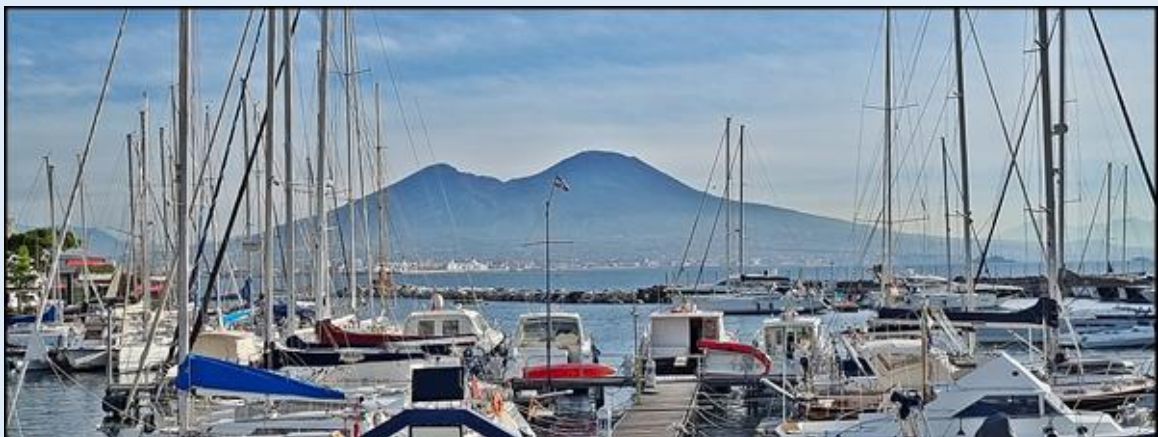
od strony portu jachtowego