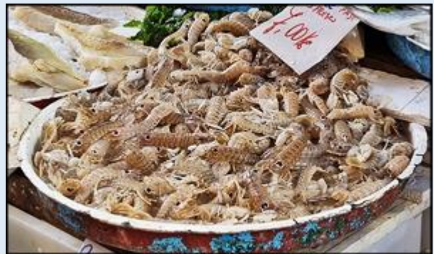
i nie tylko ryby