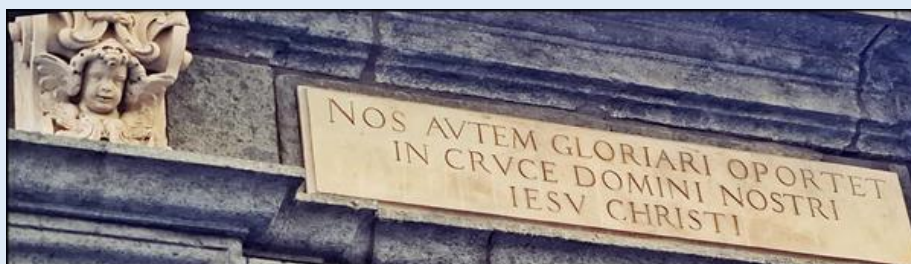
Kościół pw. Świętego Krzyża z Lucca: TRZEBA ZAŚ NAM CZCIĆ KRZYŻ PANA NASZEGO JEZUSA CHRYSYTA