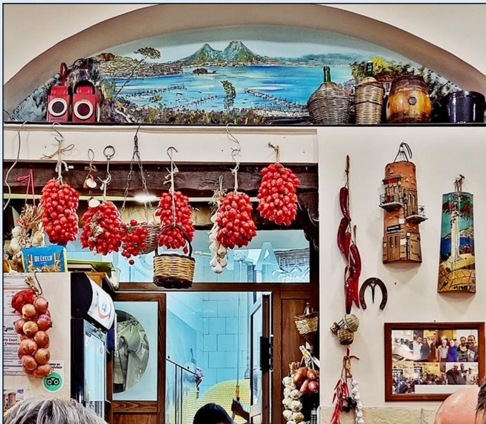
swojski wystrój restauracji