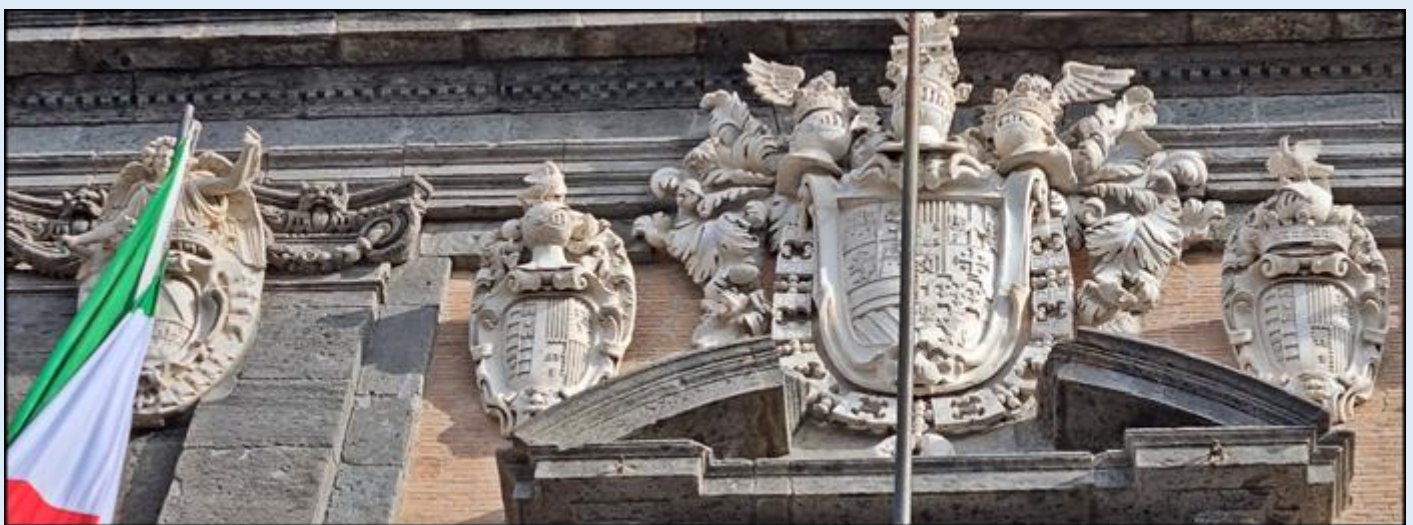
sporo zabytków: patrz Miejsca pamięci

w sumie miasto ciekawe, piękne, życzliwe... ale i tłumne oraz nieco hałaśliwe... a jednak pociągające swoim urokiem.