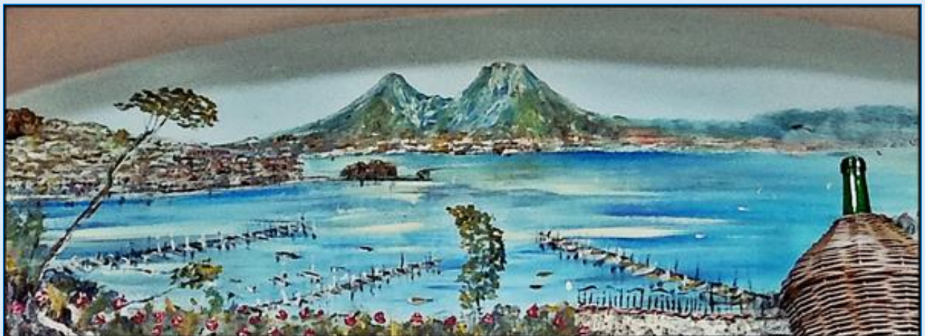
z koniecznym Wezuwiuszem