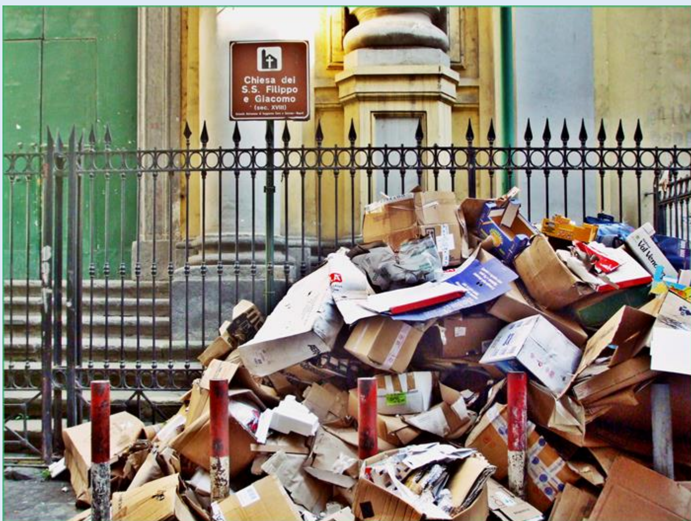
też zabytek, ale w niemiłym otoczeniu...