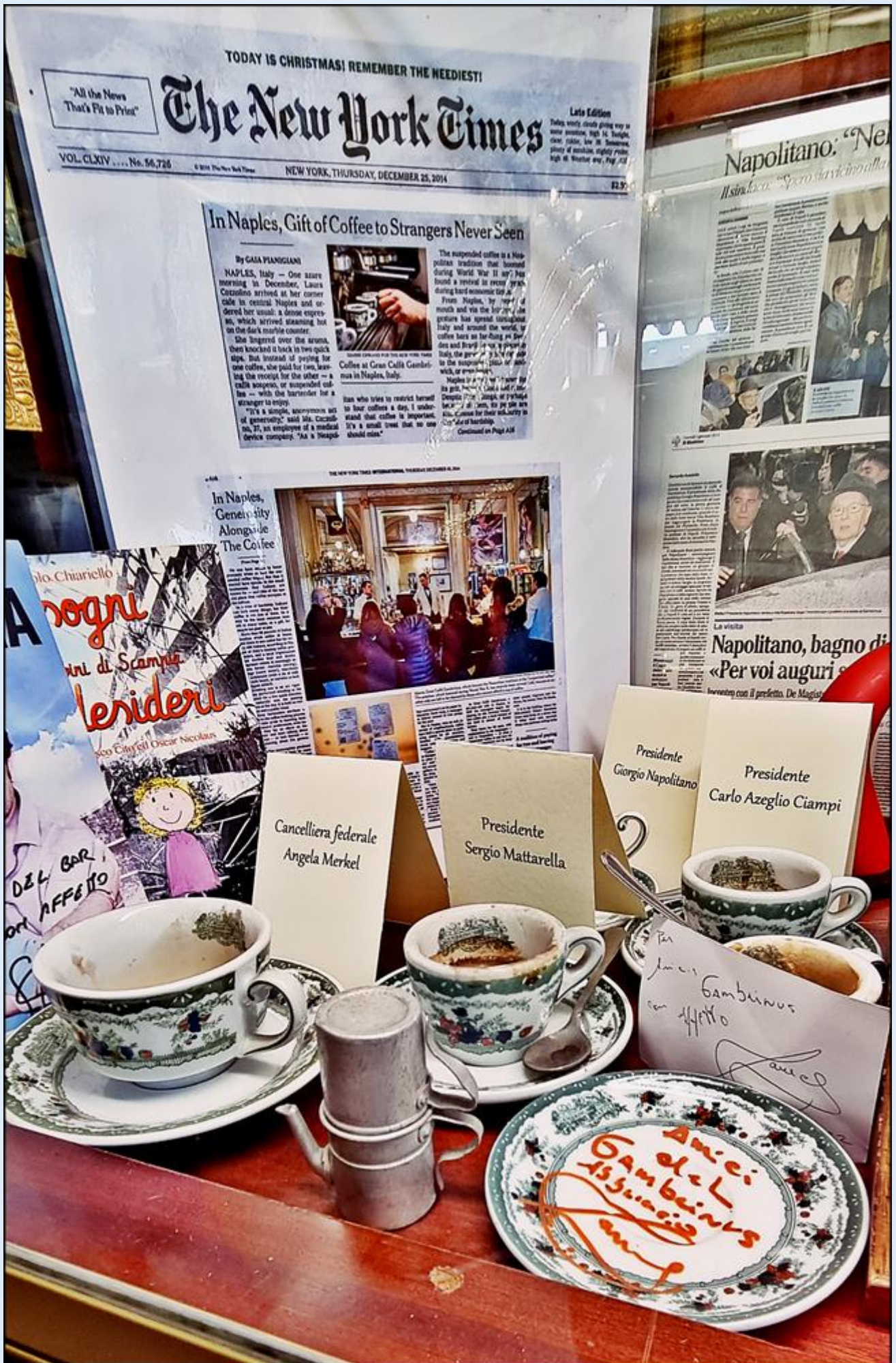
filiżanki, z których pili sławni, stanowią ekspozycję muzealną kawiarni