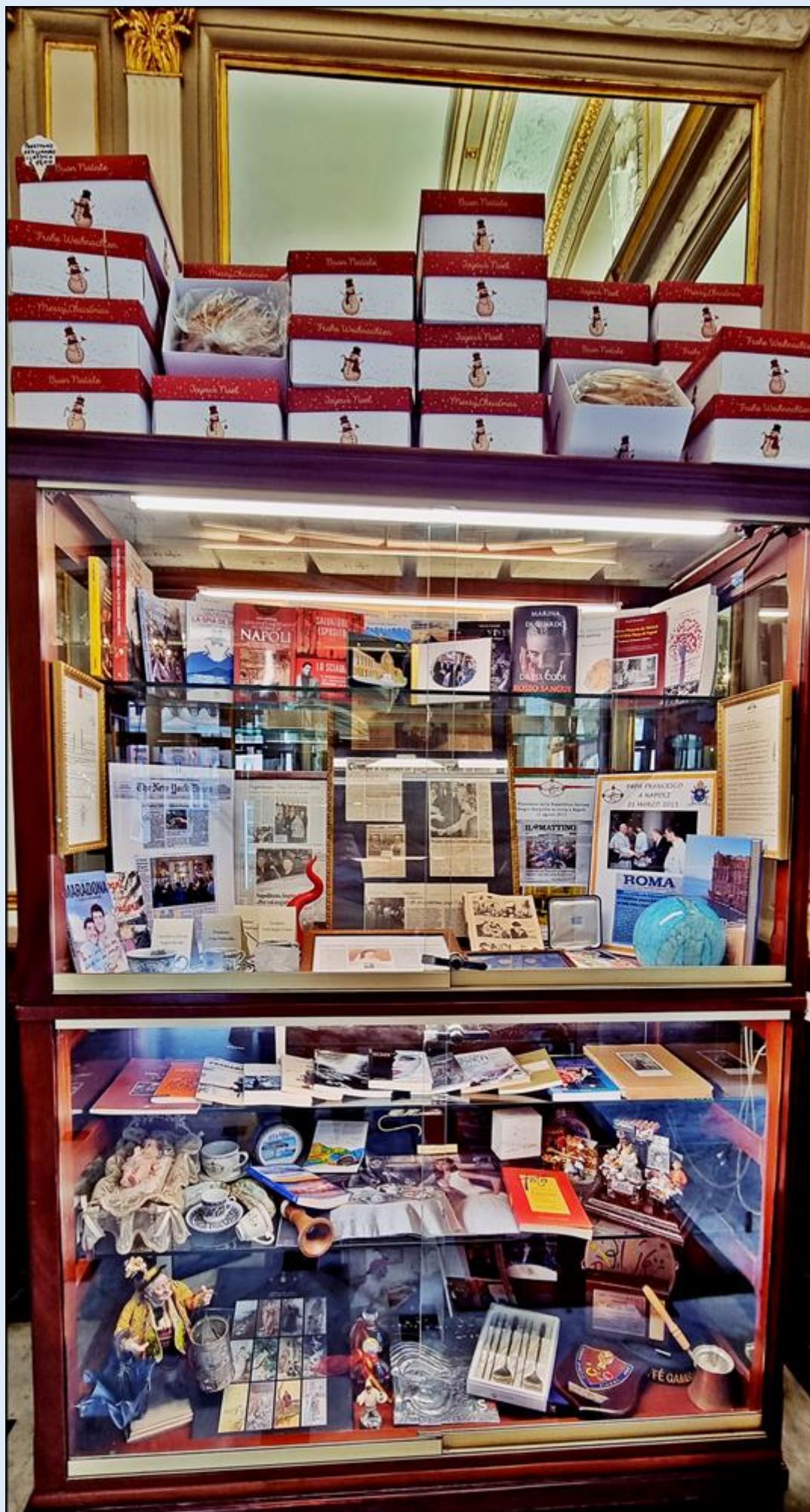
pamiątki po sławnych ...