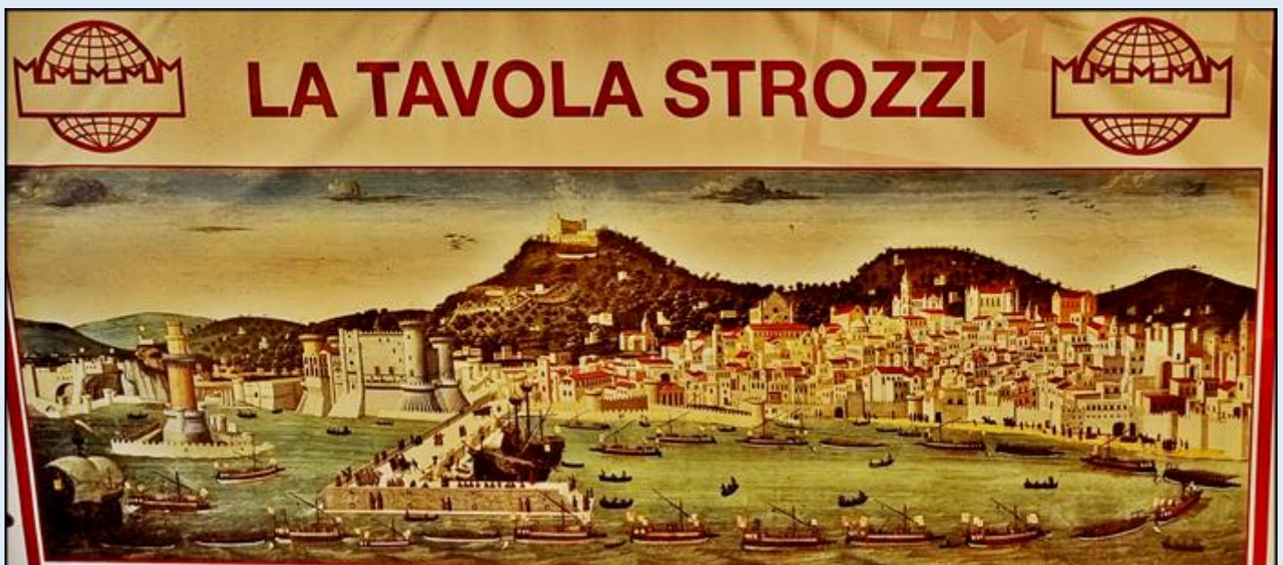
po lewej: Castel dell' Uovo, latarnia morska, Castel Nuovo i historyczny port