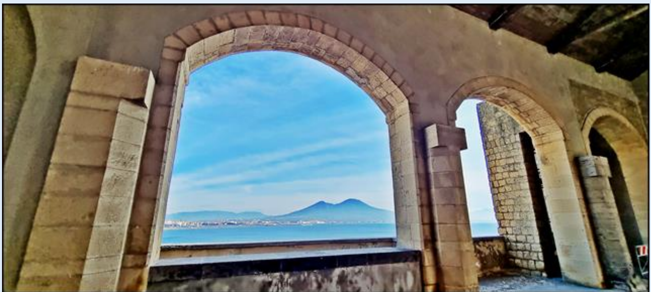
widok na Wezuwiusz z górnej części zamku