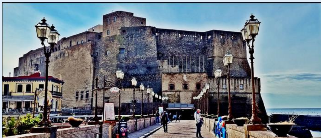
widok od północy z wejściem na zamek