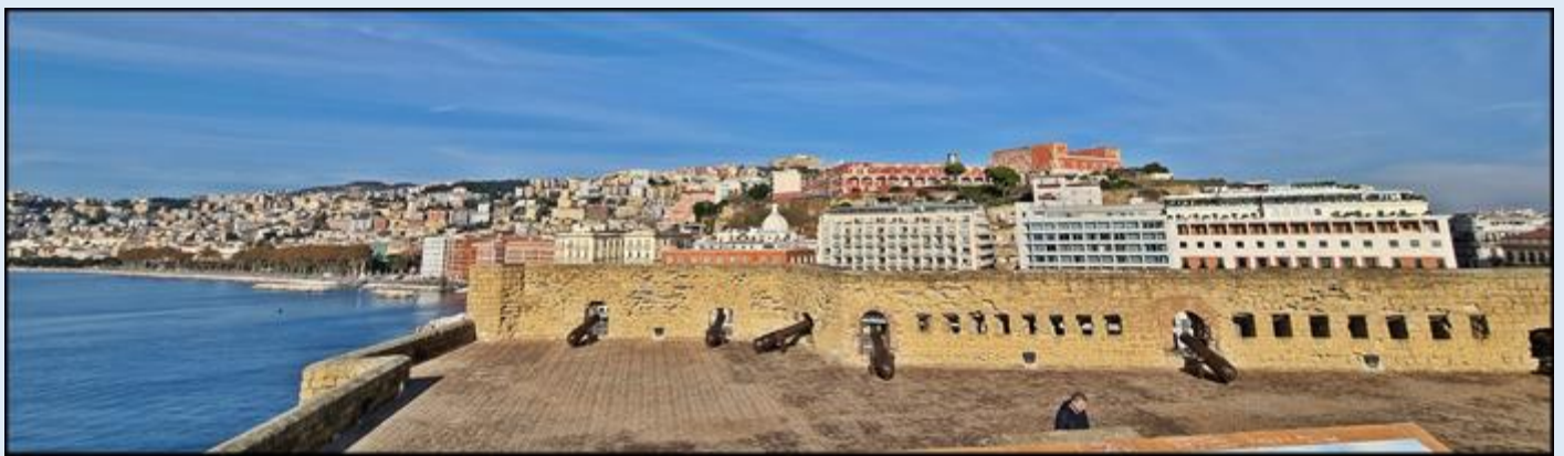
wejsie na g6rny poziom