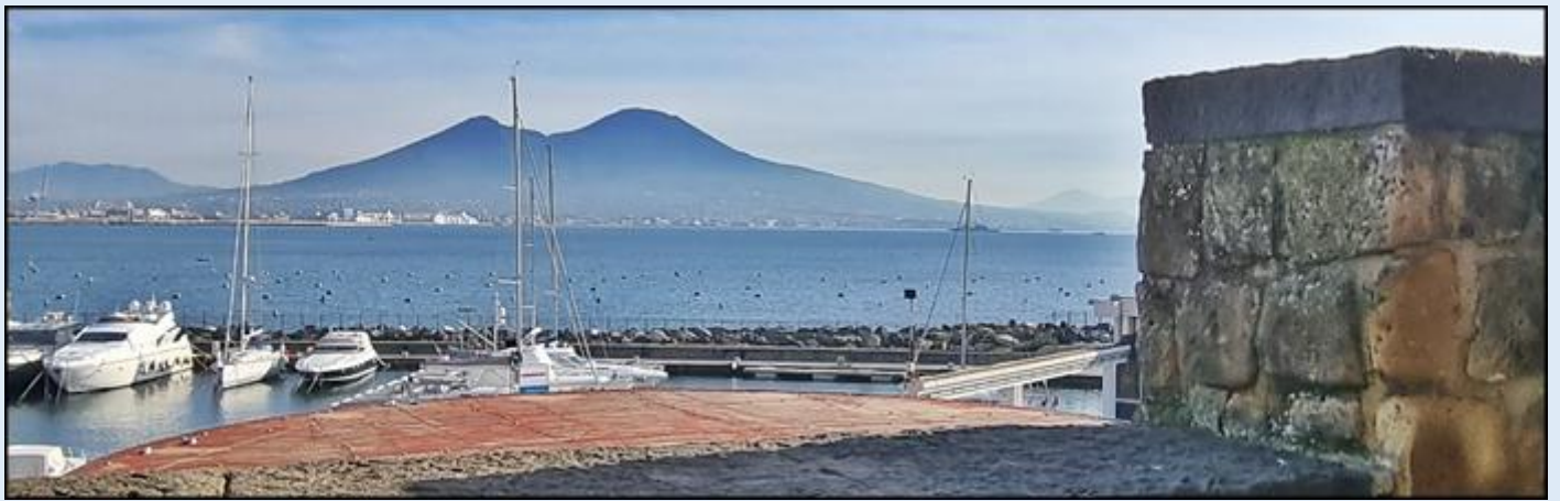
widok z zamku na Wezuwiusz