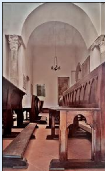
Kościółek zamkowy pw. św. Salwatora (zdjęcia z za szyby)