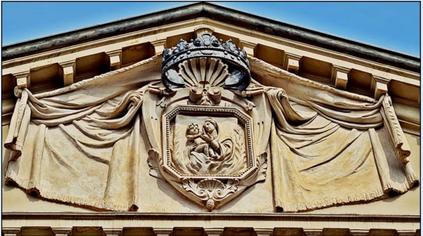
Comune di Forlì