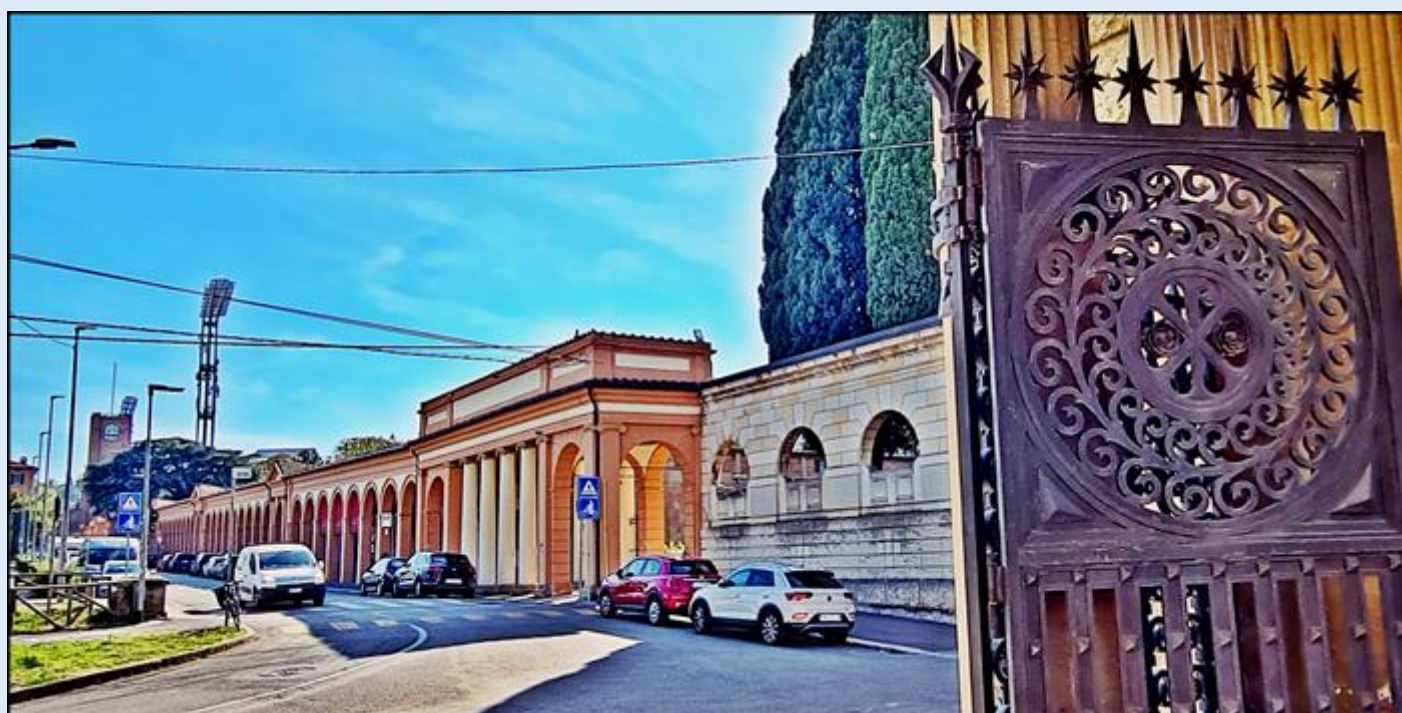
Widok na stadion (w głębi) z: Zabytkowego cmentarza Certosa Bologna