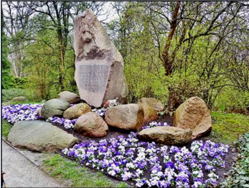
Pomnik Stanisława Jachowicza