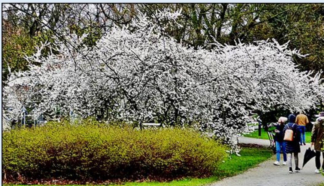
zdjęcia: Jan Nitecki

zdjęcia w czerwonym obramowaniu zapożyczono z: https://a.allegroimg.com/original/116bb1/815484de4d02bd168b25bcf31f84/WARSZAWA-Park-Ujazdowski-1907-Fot-Holewinski