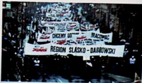
*Materiał prasowy, 04.01.02 *04.01.02, 04.01.02

8 grudnia 1992 r. weszła w życie Mała Konstytucja, co oficjalnie zakończyło okres obowiązywania Konstytucji PRL. Liczne fragmenty tej ostatniej pozostały co prawda w mocy, ale już w oparciu o postanowienia przyjętej w pełni demokratycznie Małej Konstytucji. Jednocześnie, w wyniku głębokich reform, Polska po raz pierwszy od rozpoczęcia transformacji zanotowała wzrost gospodarczy. Znakiem czasu było pojawienie się w kraju zagranicznych marek i firm. Jednak narastała także nierówność między „wygranymi” i „przegranymi” liberalnych przemian w gospodarce.