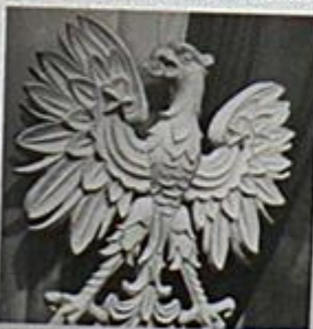
4) Godło PRL