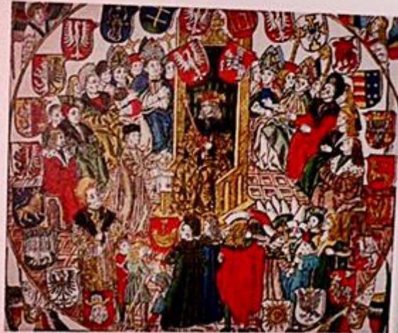
① Akt konfederacji warszawskiej 1573 roku. W zbiorze Archiwum Czernycki 401

W XVI w., w dobie krwawych wojen religijnych, Rzeczypospolita stanowiła wyjątkowy przykład pokojowego współistnienia różnych wyznań. Uchwała Konfederacji warszawskiej z 1573 r., włączona do artykułów henrykowskich, wymuszała na obejmującym władzę królu przysięgę, iż będzie przestrzegał zasad tolerancji religijnej – był to pierwszy taki akt na kontynencie europejskim i na świecie.