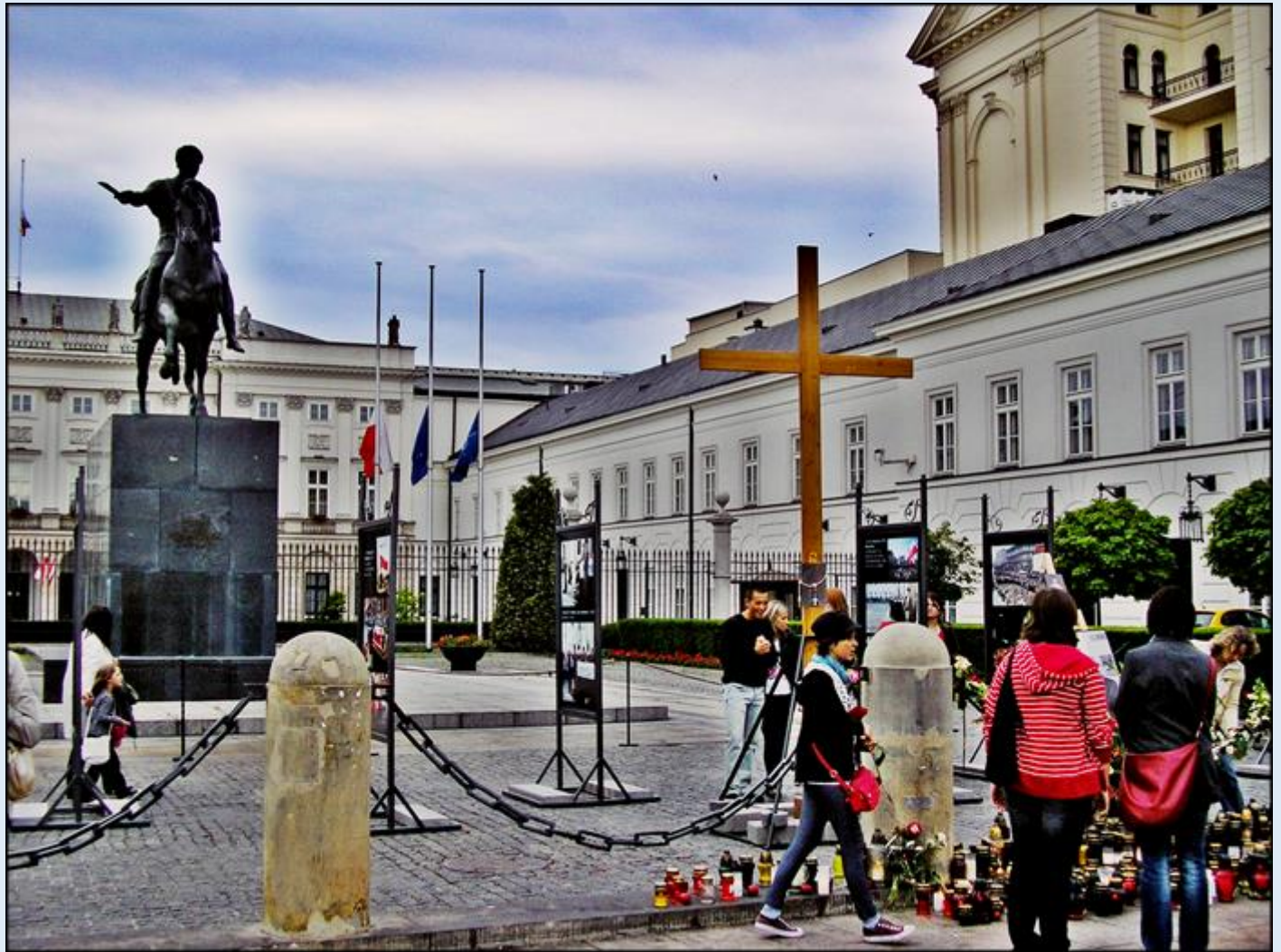
Rok 2010 (zdj. mb)