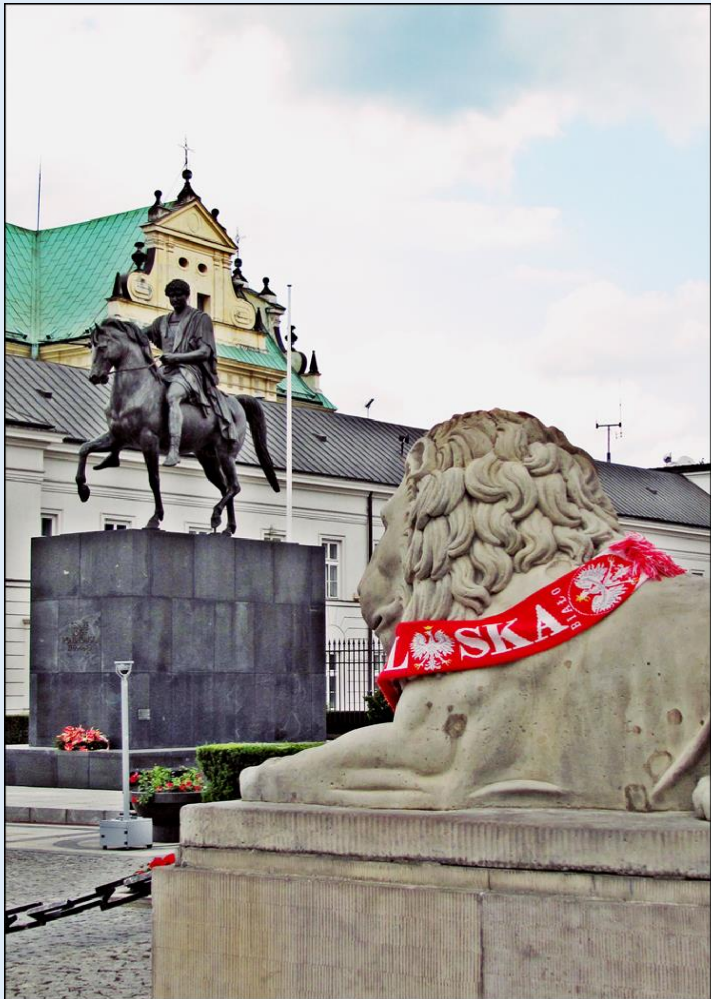
w czasie Mundialu 2012