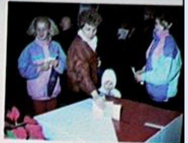
*Wybory po 1992, 04.01.02 *Zaria codzienna, 04.01.02

W założeniu sejm I kadencji miał uchwalić nową ustawę zasadniczą, więc zadano o taką ordynację wyborczą, która zapewniłaby mu możliwie największą reprezentatywność. Niestety, powtórzyła się sytuacja z II Rzeczypospolitej – w sejmie znalazło się aż 29 ugrupowań, z których zwycięska Unia Demokratyczna zdobyła zaledwie 14% mandatów. Tak rozbity wewnętrznie sejm nie zdołał wyłonić stabilnego rządu na czas realizacji trudnych reform.