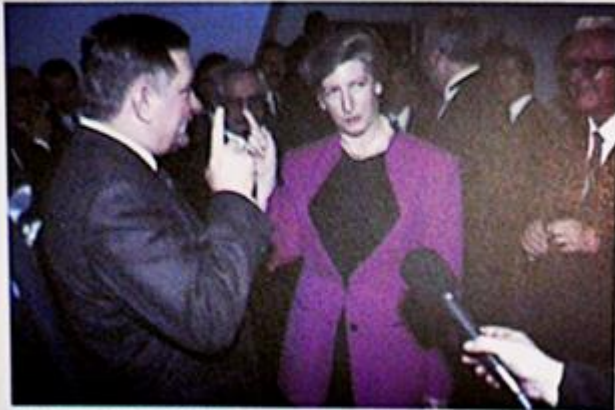
*Hanna Suchocka / Hanna Suchocka, 25.01.1992, 04.01.02

Wyborom sejm I kadencji 4 jesienią 1991 r. towarzyszyło przekonanie, że do wypracowania nowej i powszechnie akceptowanej konstytucji należy podejść ze spokojem i namysłem, czemu nie sprzyjał przedłużający się, burzliwy proces kształtowania gospodarki rynkowej, zastępującej centralnie planowaną gospodarkę socjalistyczną. Jednocześnie potrzeba wyraźnego zademonstrowania odejścia od ustroju PRL doprowadziła do uchwalenia konstytucji przejściowej, regulującej jedynie relacje między najważniejszymi organami Państwa.