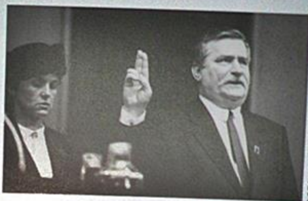
2) Zgromadzenie Prezydentów RP Lech Wałęsa

Równoległe w komisjach parlamentu rozpoczynały się już prace nad przygotowaniem nowej ustawy zasadniczej. Jednak ogrom wyzwani związanych z transformacją ustroju polityczno-gospodarczego oraz brak zgody, aby tak doniosły dokument uchwalany był przez parlament wybrany w jedynie częściowo demokratycznych wyborach sprawiły, że zadanie to odziedziczył sejm I kadencji, wybrany w 1991 r.