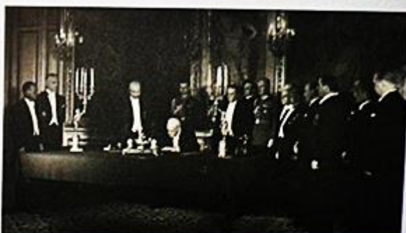
• Prezydent RP Ignacy Mościcki podpisuje Konstytucję Kwieciwną, 23.04.1935

Na początku czerwca 1926 r. ten sam parlament, przeciwko większości którego skierowany był zamach majowy, wybrał na prezydenta Rzeczypospolitej Józefa Piłsudskiego. Piłsudski, który uważał, że prezydent ma ograniczone uprawnienia konstytucyjne, nie przyjął tej funkcji, oświadczył jednakże, że sama propozycja była legalizacją dokonanego przewrotu.