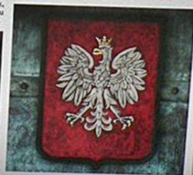
5) Godło Apłatajczy w Warszawie