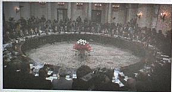
1) Okrągły Stół, 6.02.1989

Stosowne zmiany w Konstytucji PRL sejm uchwalił 7 kwietnia 1989 r.