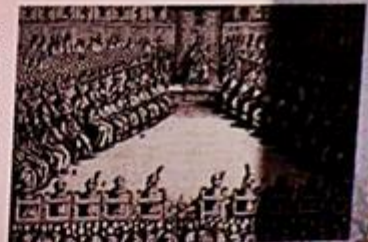
③ Sejmiki. Łódź, Sept 2016. In: Głosy. Czernycki 401. W zbiorze Archiwum Czernycki 401

W obradach sejmu obowiązywała zasada jednomyślności (liberum veto), chwalebna z punktu widzenia poszanowania głosu mniejszości i wymogu wypracowywania satysfakcjonującego wszystkie strony porozumienia. W zdegenerowanej formie, jaką zaczęła przybierać w połowie XVII w. (zrywanie sejmów i blokowanie reform), chroniła ona jednak wyłącznie interesy magnatów i uniemożliwiała efektywne funkcjonowanie państwa.