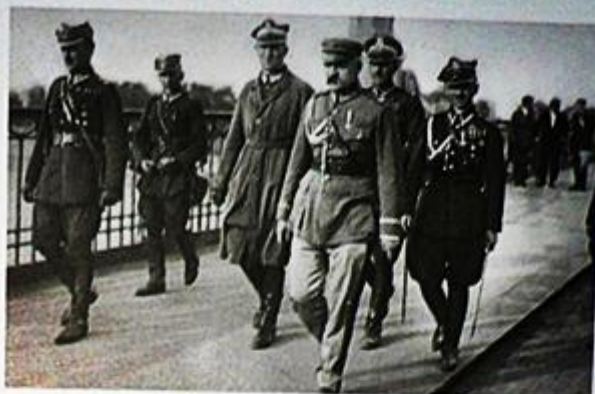
• Marszałek Józef Piłsudski w dniu przewrotu majowego na moście Piłsudskiego w Warszawie, 12.05.1926

Po drugiej wojnie światowej, w osobach kolejnych prezydentów RP na uchodźstwie 2 , Konstytucja Kwieciwna miała stać się symbolem sprzeciwu i oporu przeciw narzuconemu Polsce obcemu porządkowi.