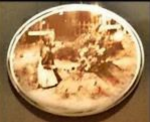
Miasto grobów A city of graves