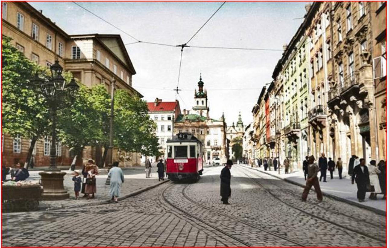
Rynek lwowski w roku 1938