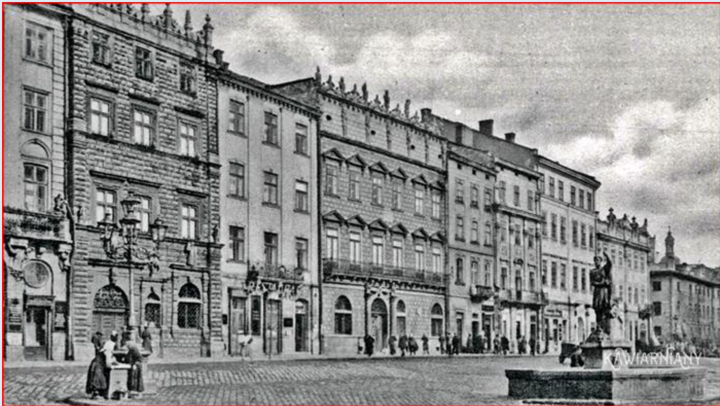
Rynek Lwowa z Czarną Kamienicą i Kamienicą Królewską