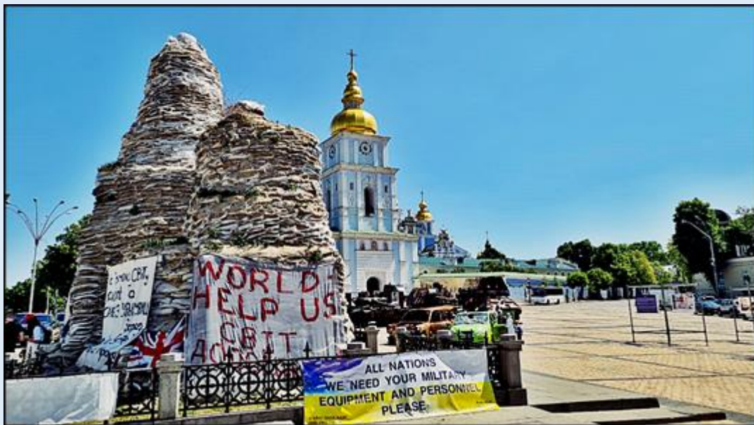
Plac przed Ławrą Peczerską w czasie wojny