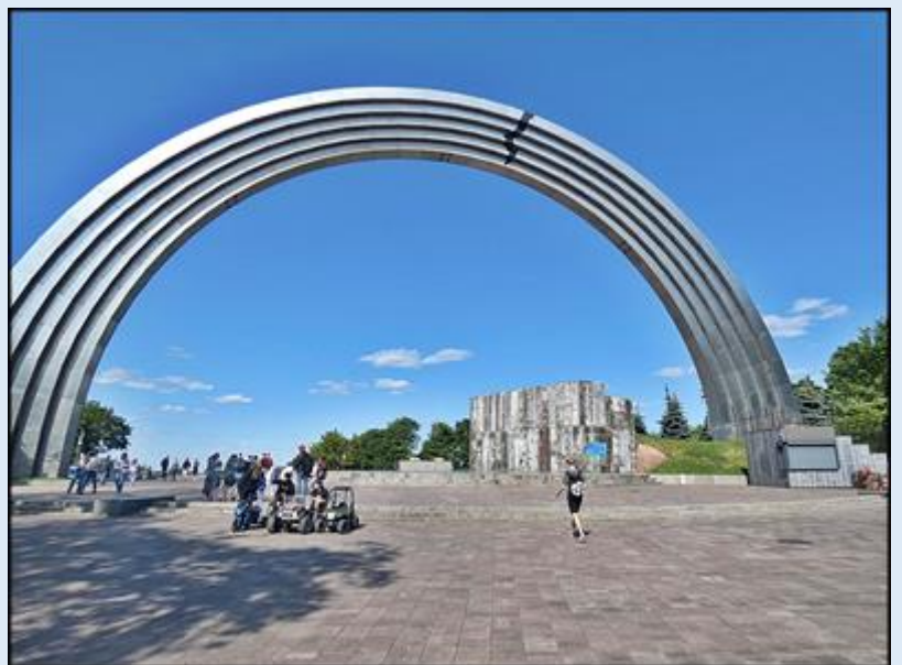
Monastyr (Cerkiew) Michajłowski o Złoty Kopyłach - Łuk Przyjaźni Narodów