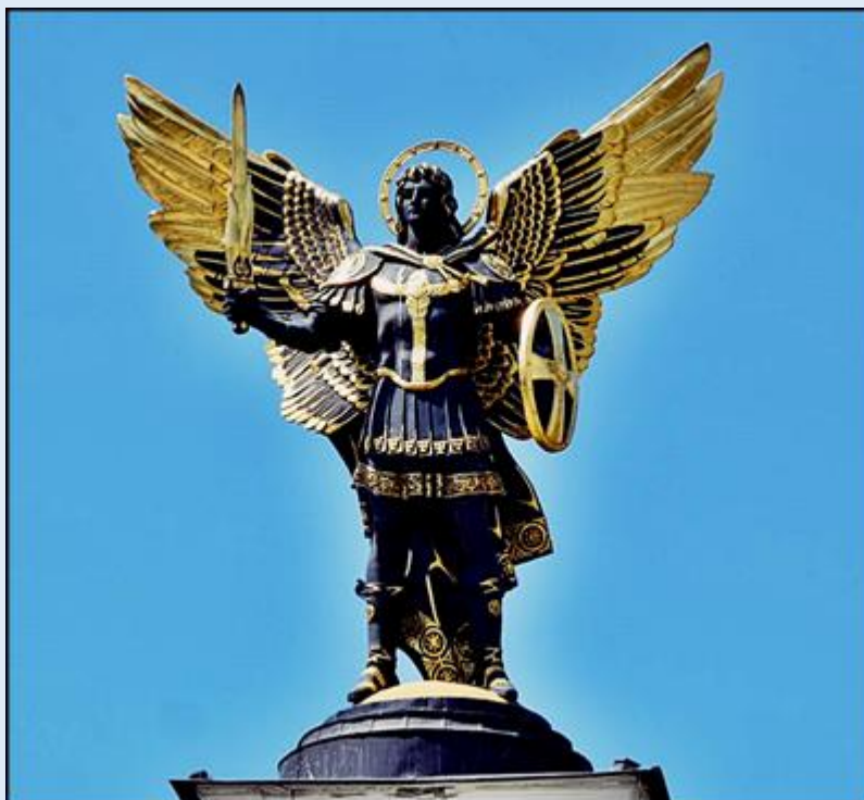
Pomnik św. Michała Archanioła, patrona Ukrainy i Kijowa, na Placu Niepodległości