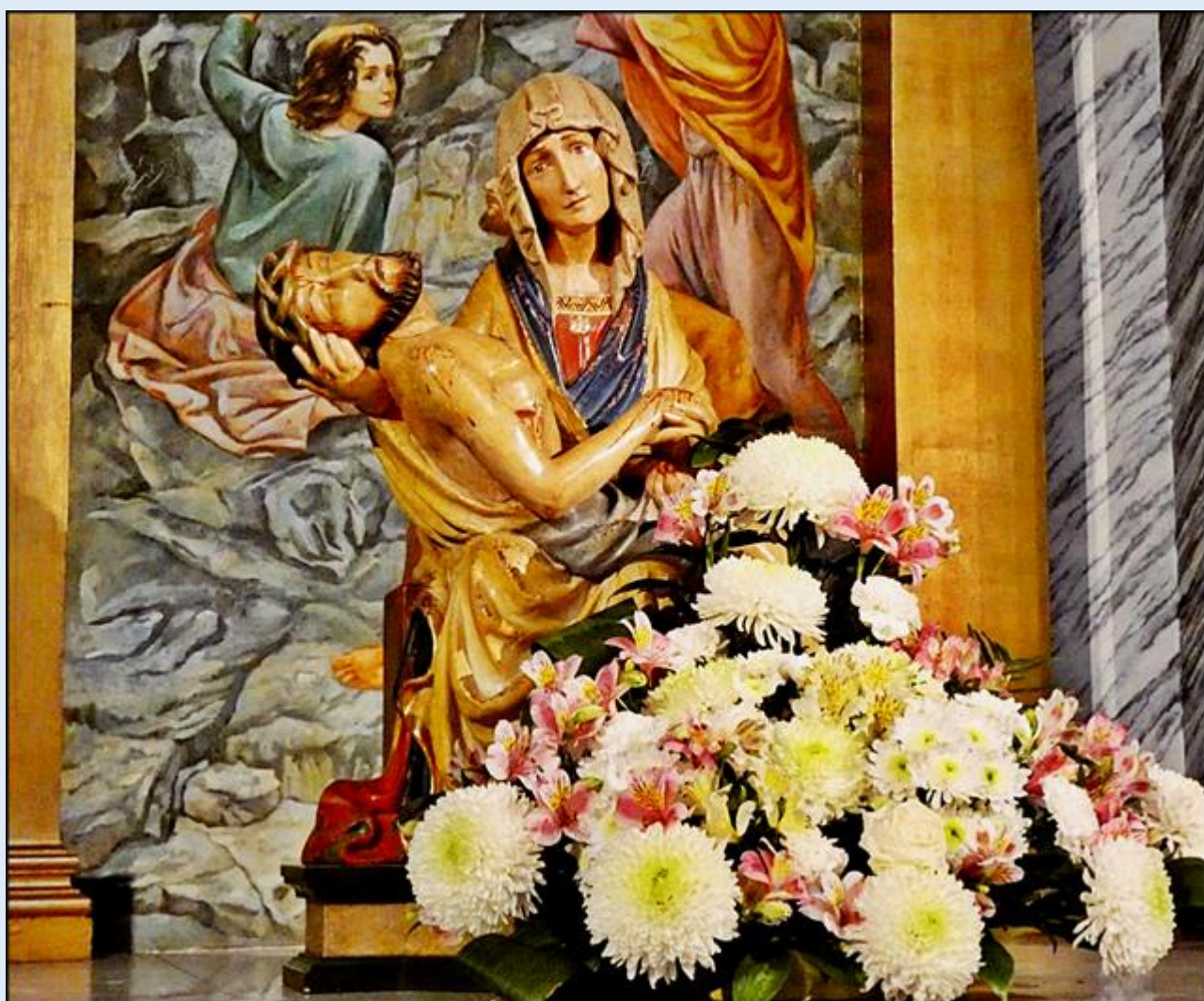
Rzymsko-katolicka Konkatedra pw. św. Aleksandra

(koniec maja 2023 r.)