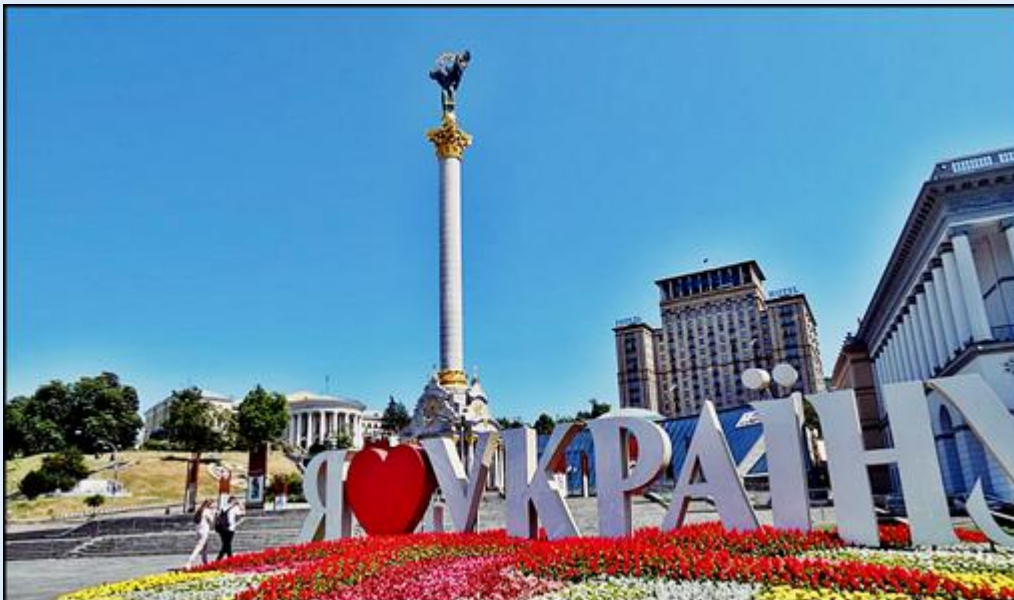
Majdan, plac główny Kijowa z Kolumną Niepodległości