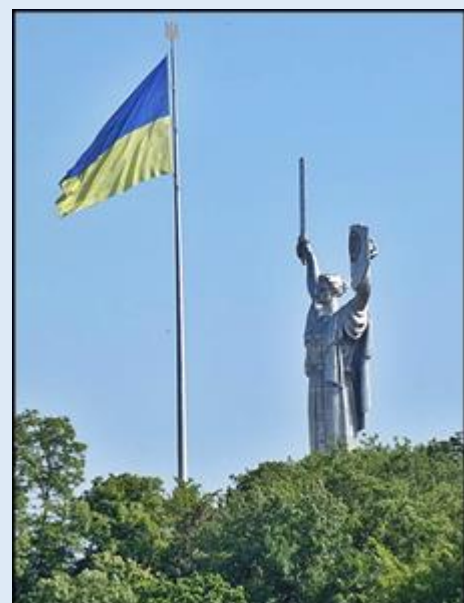
Pomnik 'Matka Ojczyzna'