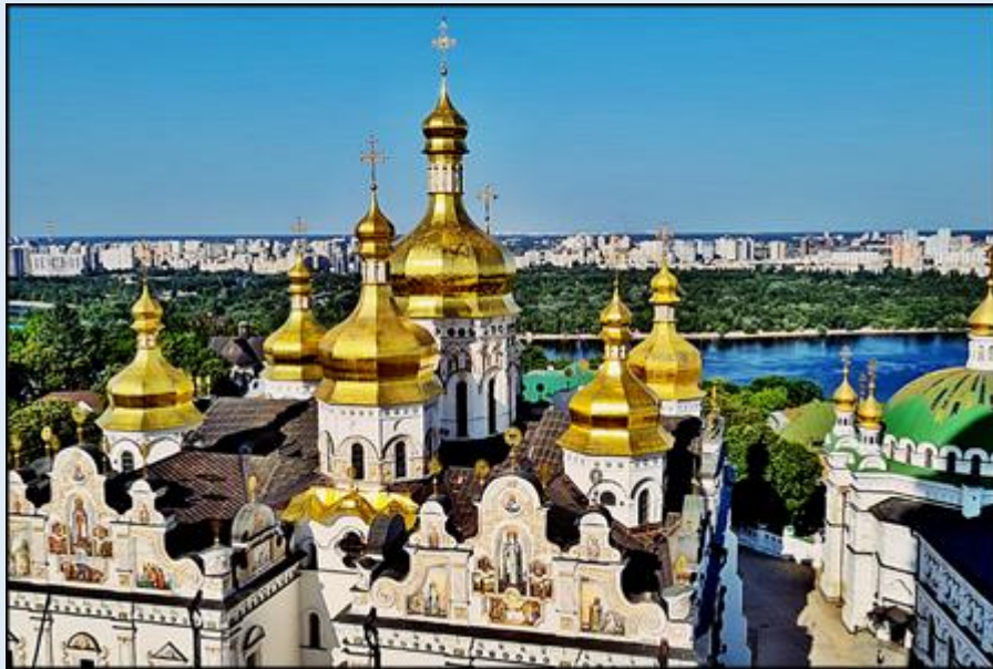
Prawosławny klasztor Ławra Peczerska