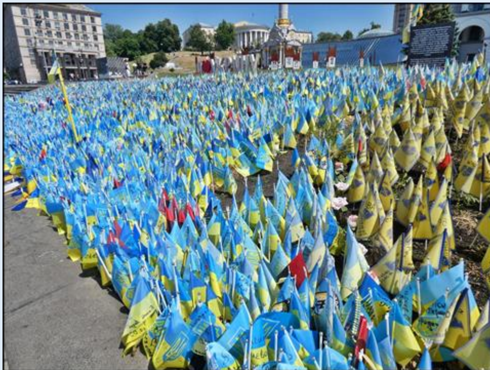
flagi - symboliczne groby poległych