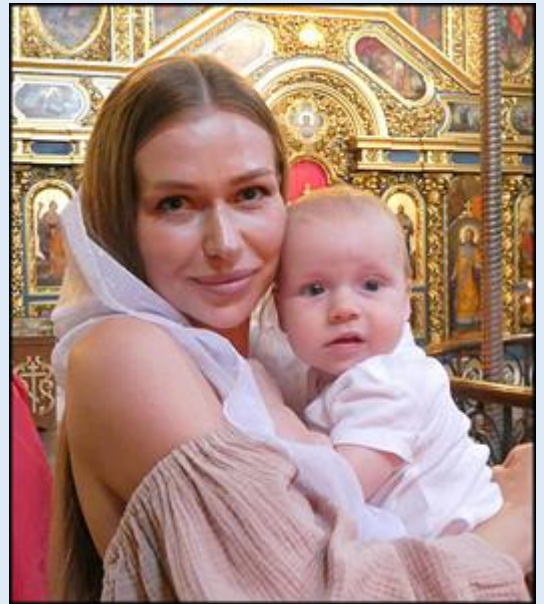
Monaster (Cerkiew) Michajłowski o Złoty Kopułach