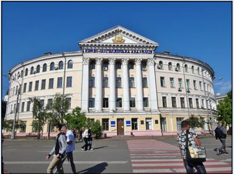
Pomnik Piotra Konaszewicza Sahajdacznego - Akademia Kijowsko-Mohylańska