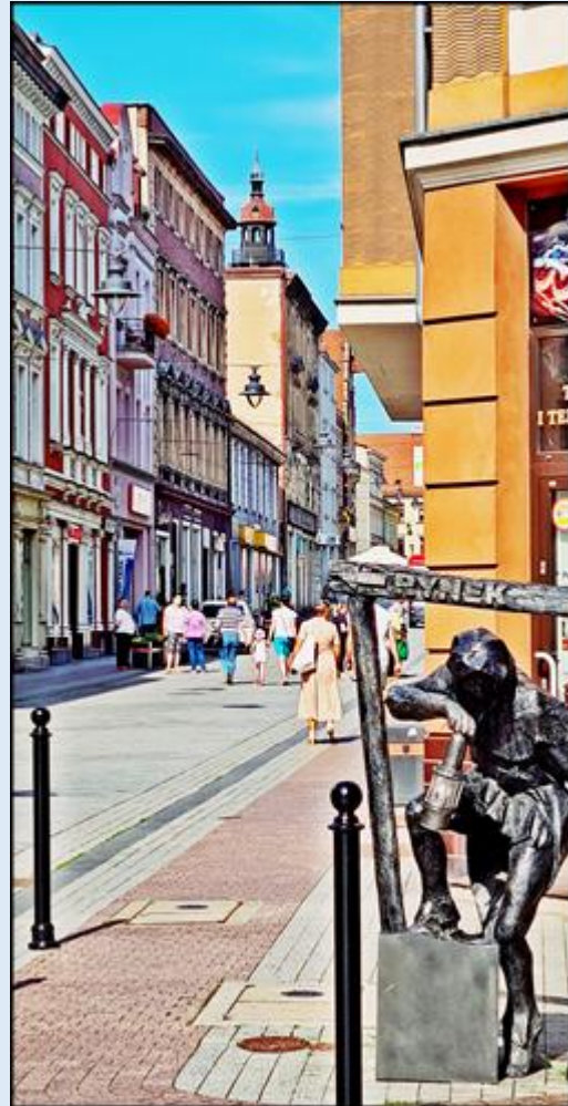
i jeszcze inny gwarek kieruje na Rynek Miasta przy ul. Krakowskiej