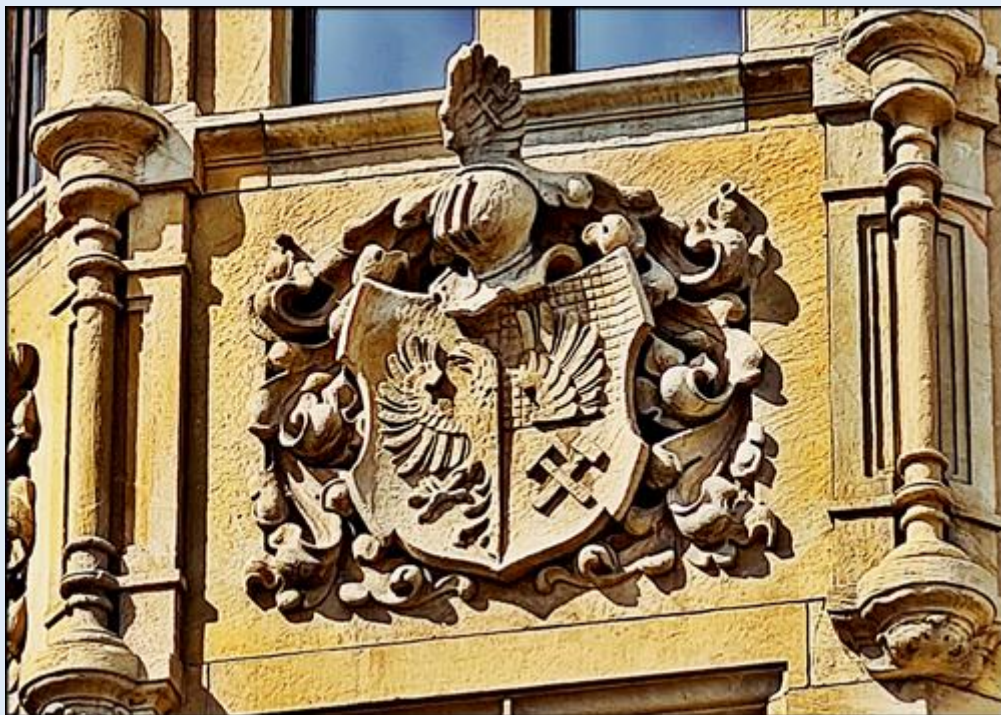
Herby na budynku Ratusza; na skrzyżowaniu ścian – herb Tarnowskich Gór