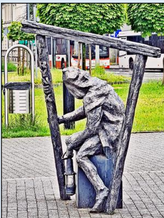
i gwarek wskazujący drogę z dworca kolejowo-autobusowego na Rynek Miasta