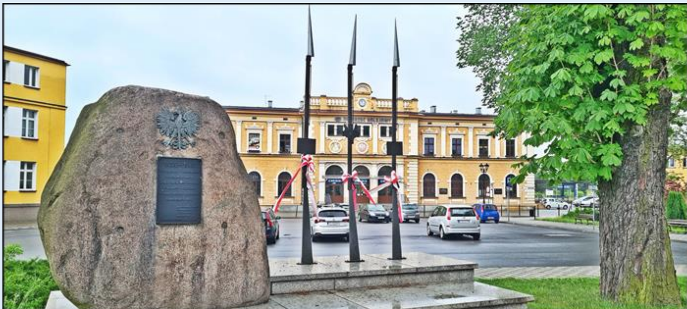
Dworzec kolejowy i Pomnik Poległym Kolejarzom