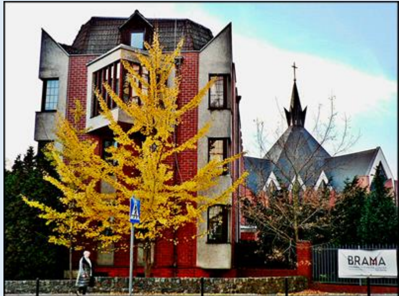
zob. Kościoły Szczecina