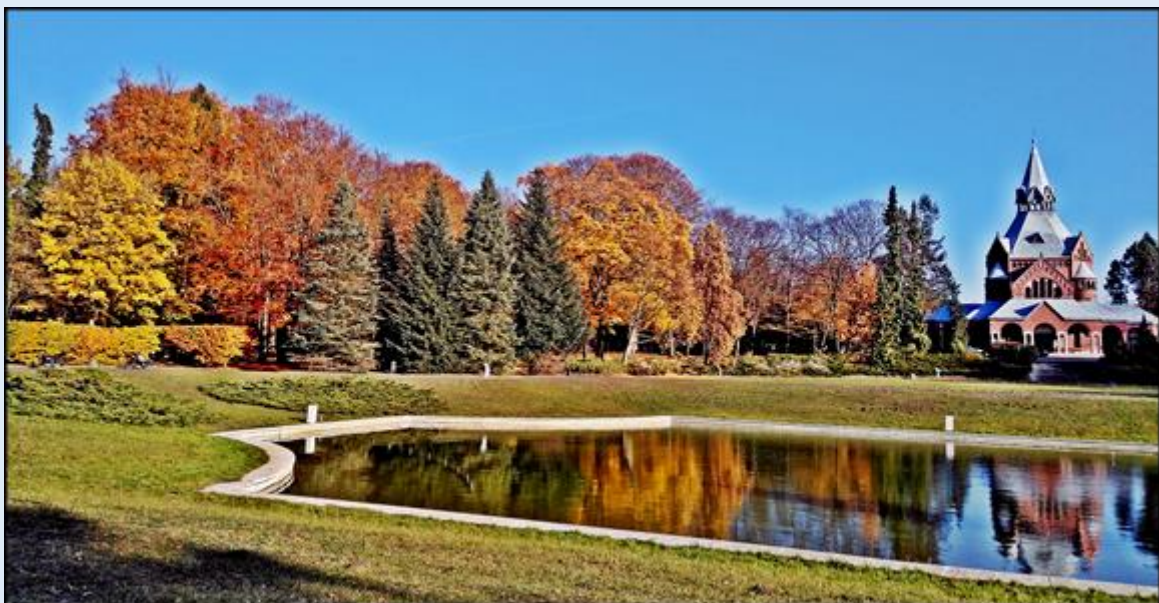
Kaplica Cmentarza Centralnego