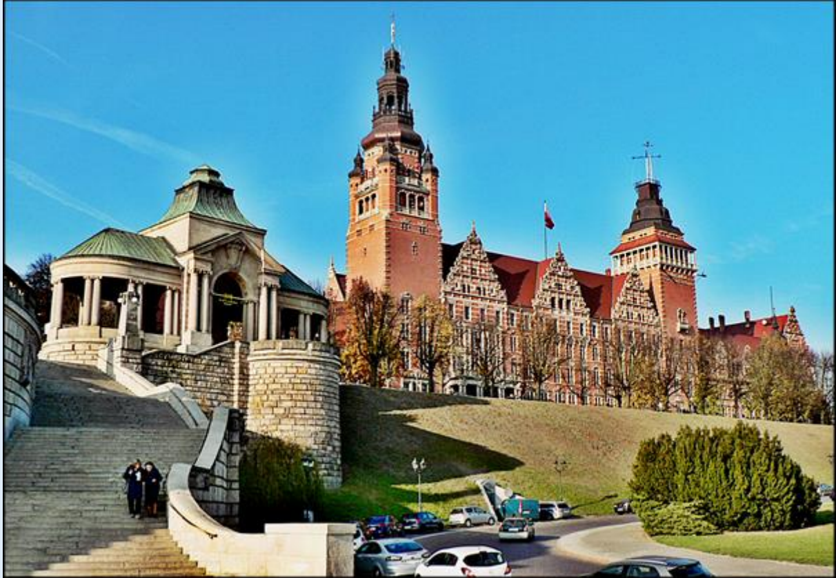
zob. Wały Chrobrego