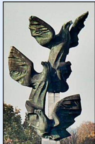
Tablica gen. Leopolda Okulickiego - Pomnik Czynu Polaków