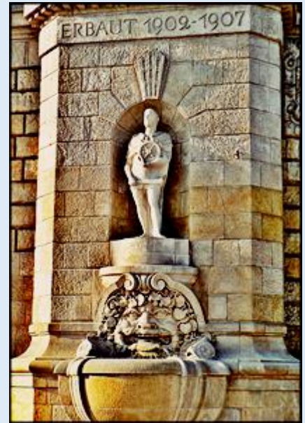
Pomnik Kornela Ujejskiego