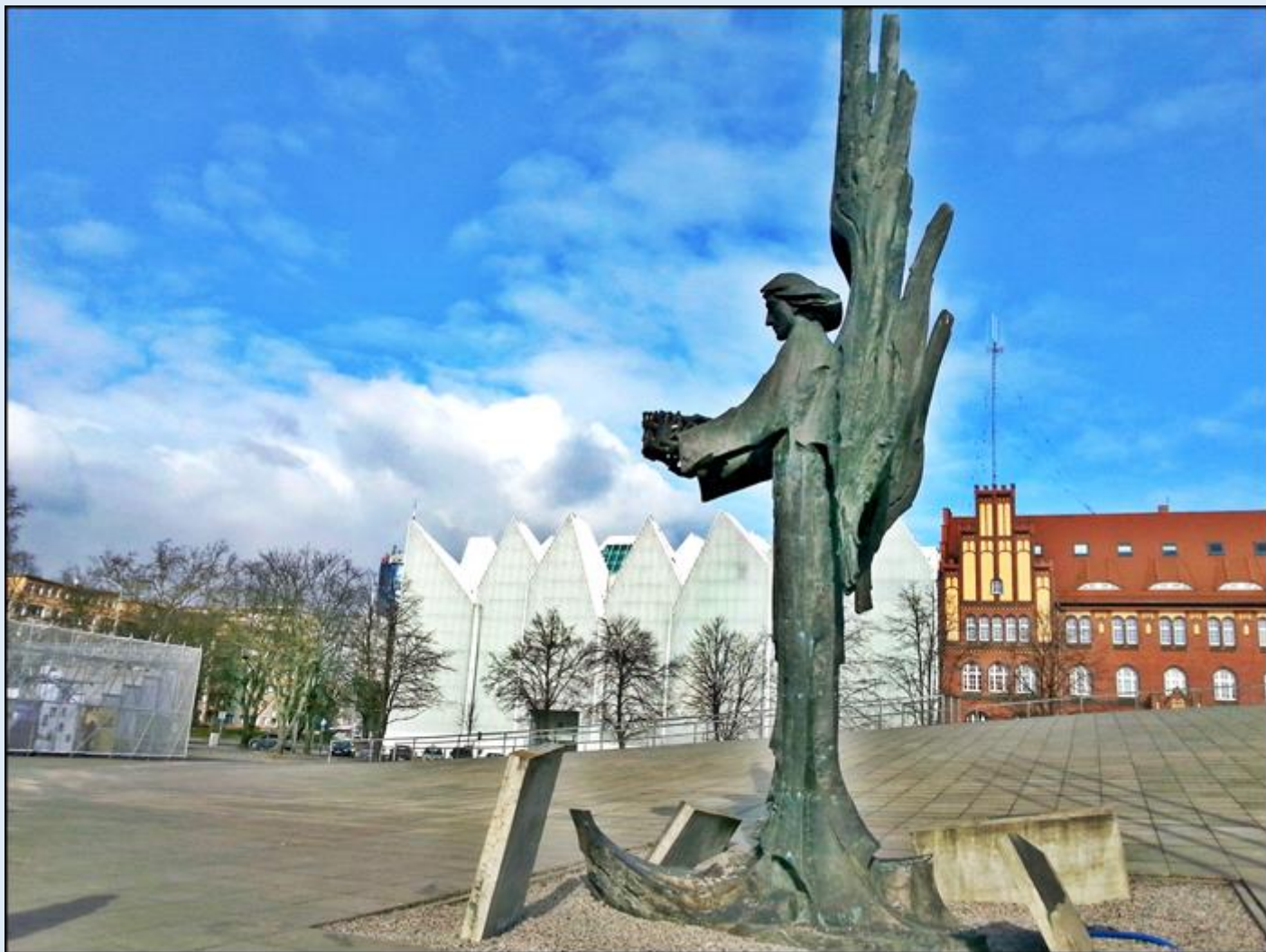
Na tle Filharmonii Szczecińskiej