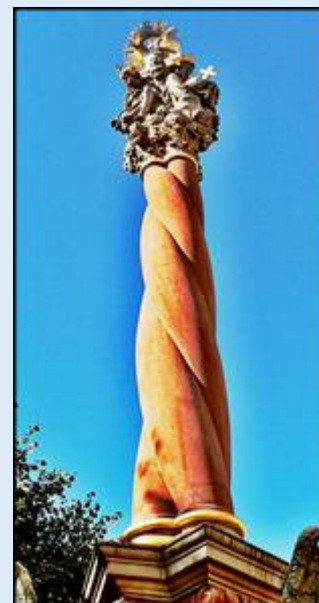
zob. Kolumna Trójcy Świętej z XVII w.