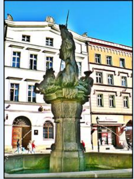
Fontanna Neptuna z 1732 r.