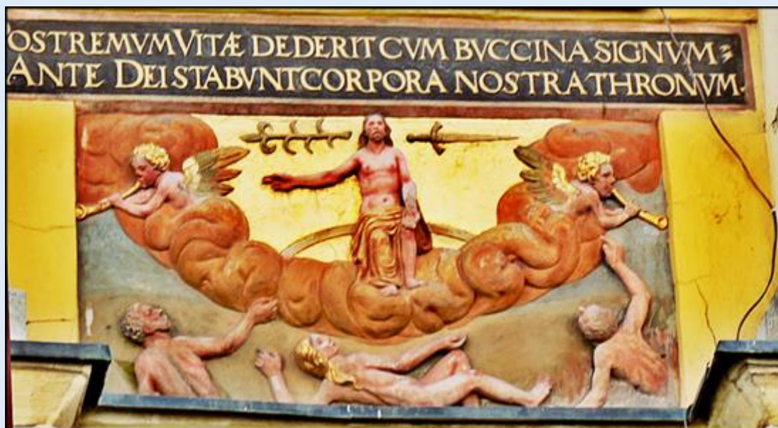
W KOŃCU, GDY TRĄBA DA ZNAK ŻYCIA, STANĄ NASZE CIAŁA PRZED TRONEM BOGA.