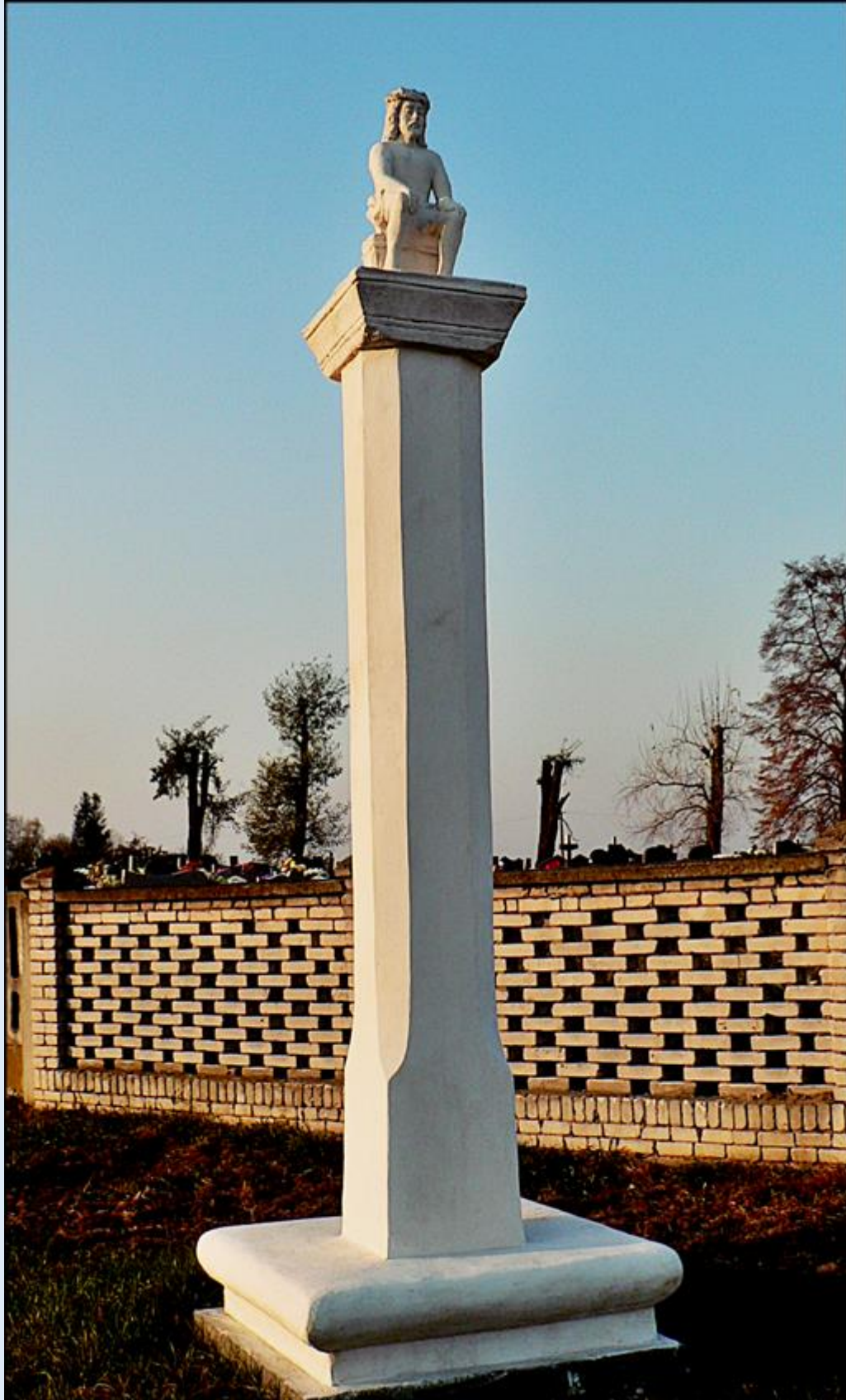
Figura Chrystusa Frasobliwego z XVII w.