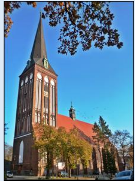
zob. Kościoły Stargardu