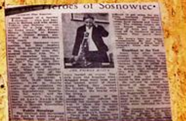
HEROES OF SOSNOWIEC

„Warunki mieszkaniowe były okropne. W jednym pokoju mieszkało 10-12 osób, czasami obozowali pod gołym niebem, aż dostali jakiś kąt. Duża część zostawiła meble, gdyż nie było ich gdzie umieścić, wielu zostawiło meble pod gołym niebem już po przewiezieniu. Przesiedlenie ukończyło się 10 marca 1943 r. Po tym terminie miasto opustoszało. Tylko ci, którzy pracowali w szopach, mogli przychodzić do miasta do pracy. Gmina urzędowała na Środuli. Po mieście nie wolno było chodzić i rodziny ze Środuli i Starego Sosnowca nie mogły się komunikować bez przepustki. Przepustki wydawała gmina. Ludzie ze Starego Sosnowca starali się przedostać na Środulę i za tę protekcję żądała wiele pieniędzy. Jednak po miesiącu, w kwietniu 1943 r., gestapo zarządziło, aby wszystkich ze Starego Sosnowca włączyć do Środuli i wszystkich ścieśniono na Środuli”.