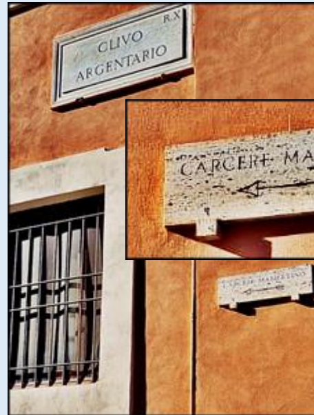
zejście od strony Via dei Fori Imperiali