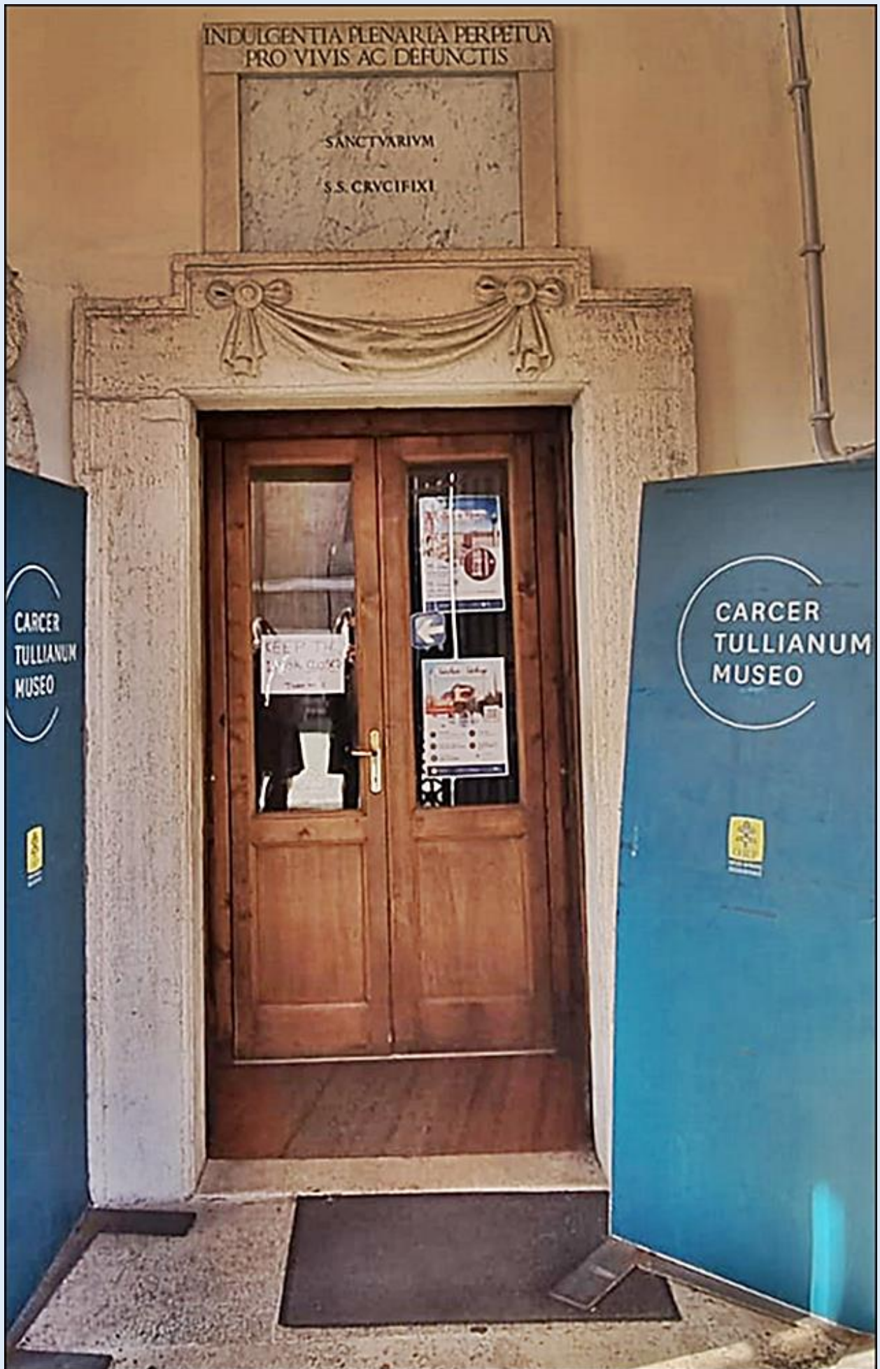
NIEUSTANNY ODPUST ZUPEŁNY ZA ŻYWYCH I ZMARŁYCH SANKTUARIUM KRZYŻA PRZENAJŚWIĘTSZEGO