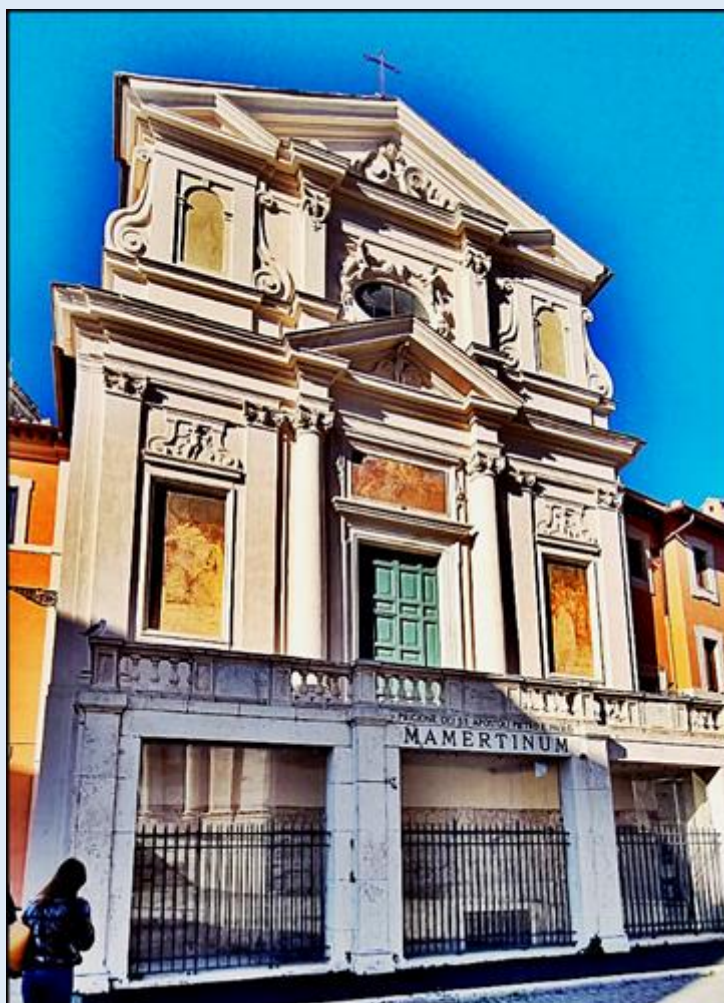
dolna część to Więzienie Mamertyńskie, nad którym wzniesiono Kościół pw. św. Józefa Cieśli (dawniej zwany też pw. śś. Piotra i Pawła w Więzieniu – S. Pietro in Carcere)