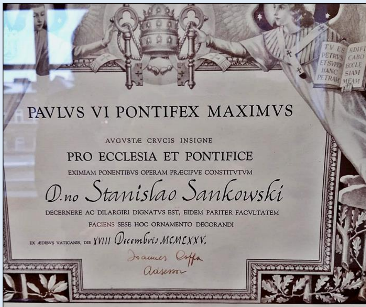
Nagroda Krzyża i Dyplomu papieża Pawła VI za zasługi dla Kościoła i Papiestwa PRO ECCLESIA ET PONTIFICE w dniu 18 grudnia 1975 r.