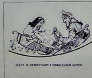
SCYTA ZE SZERKICZKAZY Z WYKAZEM SOTÓW