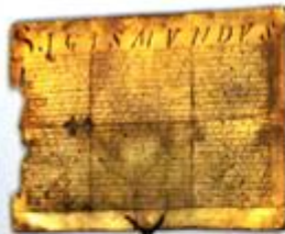
Fragment protokołu sejmiku województwa radomskiego z 1510 r. (fragmenty z 1510 r. i 1511 r.)