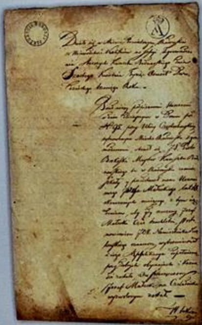
Świadectwo wyzwolenia na czeladnika cechu bednarskiego, 1823 *