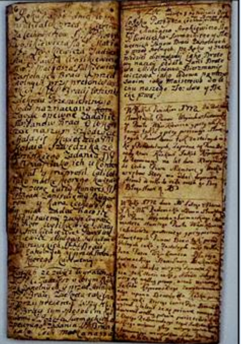
Fragment protokołu cechu szewskiego *