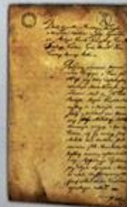
Sejmik województwa radomskiego z 1510 r.