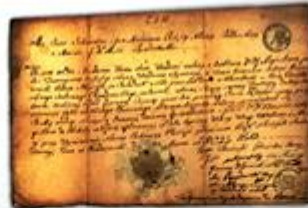
Sejmik województwa radomskiego z 1510 r.