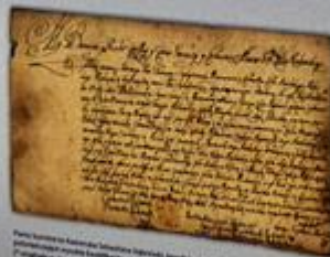
Sejmik województwa radomskiego z 1510 r.