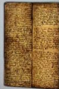
Fragment protokołu sejmiku województwa radomskiego z 1510 r.