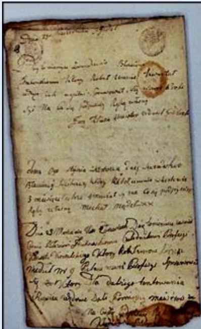
Zaświadczenie o ukończeniu terminowania, 1801*