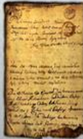
Sejmik województwa radomskiego z 1510 r.