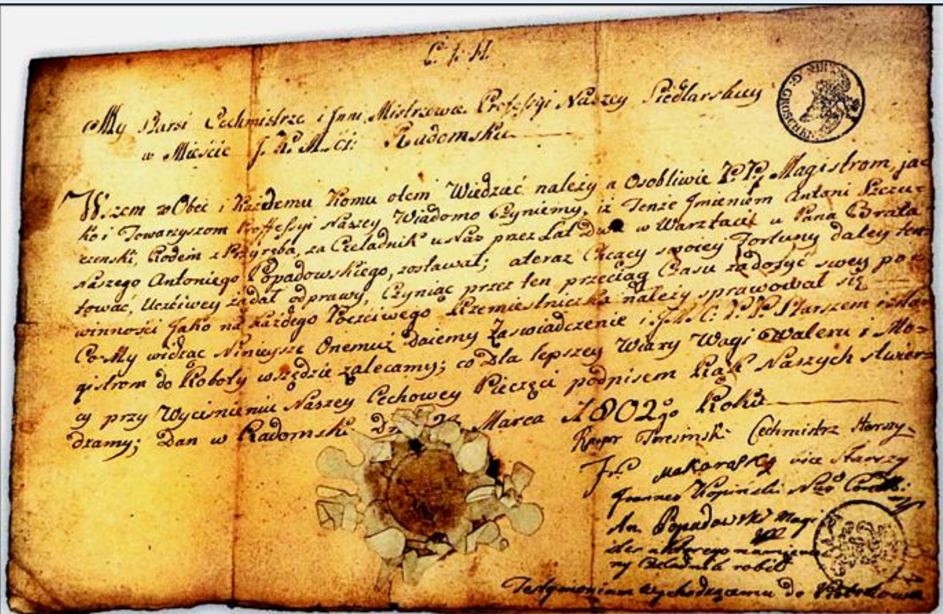
Świadectwo wyzwolenia na czeladnika cechu siodlarskiego z 1802 roku *