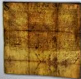
Fragment protokołu sejmiku województwa radomskiego z 1510 r.