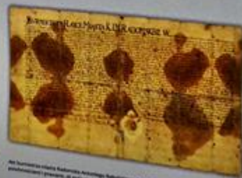
Sejmik województwa radomskiego z 1510 r.