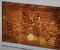
Sejmik województwa radomskiego z 1510 r.