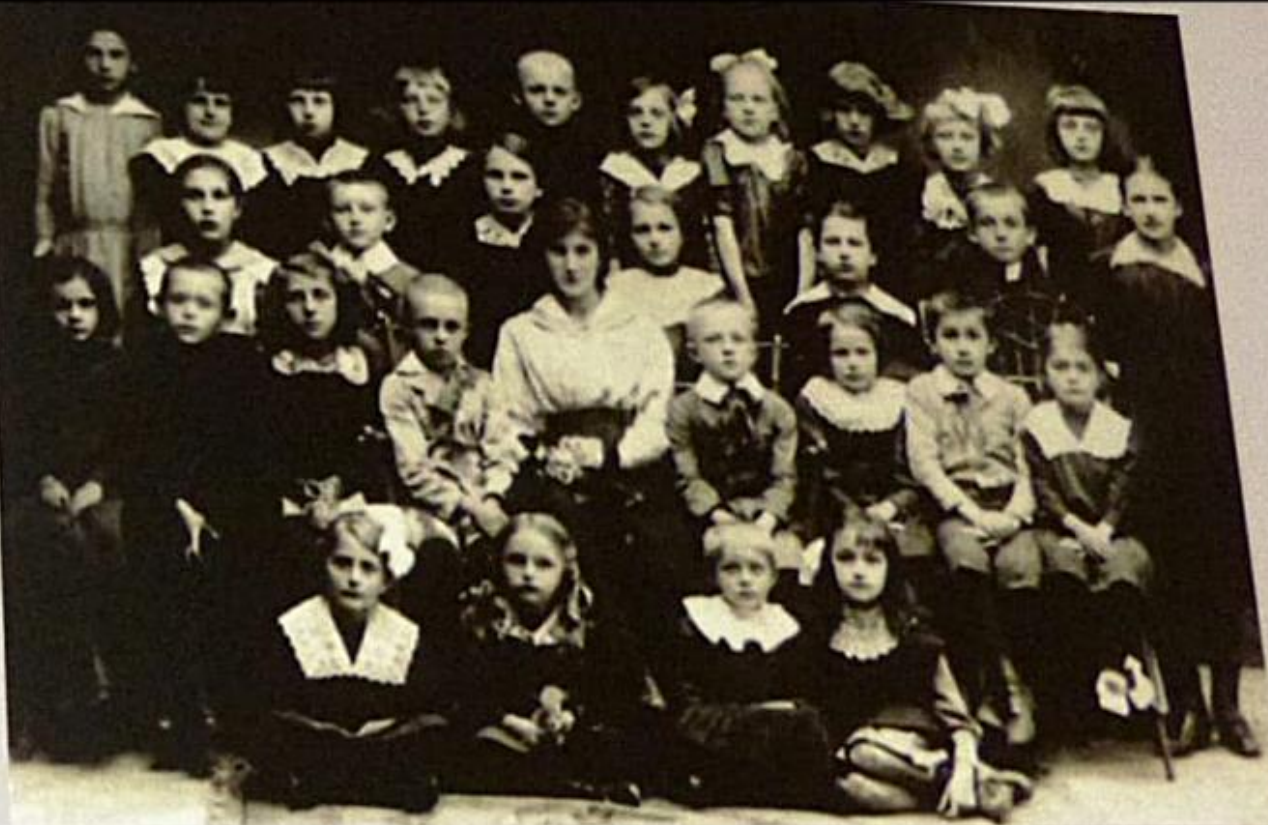
Uczniowie prywatnej koedukacyjnej szkoły powszechnej Karoliny Klar, działające w dwudziestoleciu międzywojennym