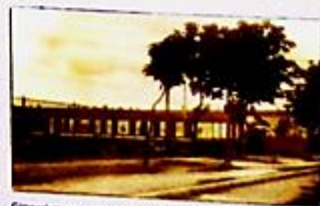
Gimnazjum społeczne im. F. Fabianiego, ul. Stanica, okres międzywojenny