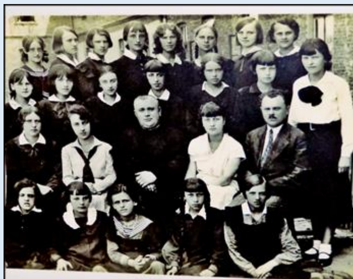
Uczennice VII klasy Szkoły Powszechnej im. Marii Konopnickiej. Rok szkolny 1931/32 r.