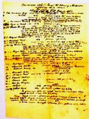
Szkoła uczniów szkoły Feliksa Fabianiego w pierwszym roku istnienia, rok szkolny 1862/63