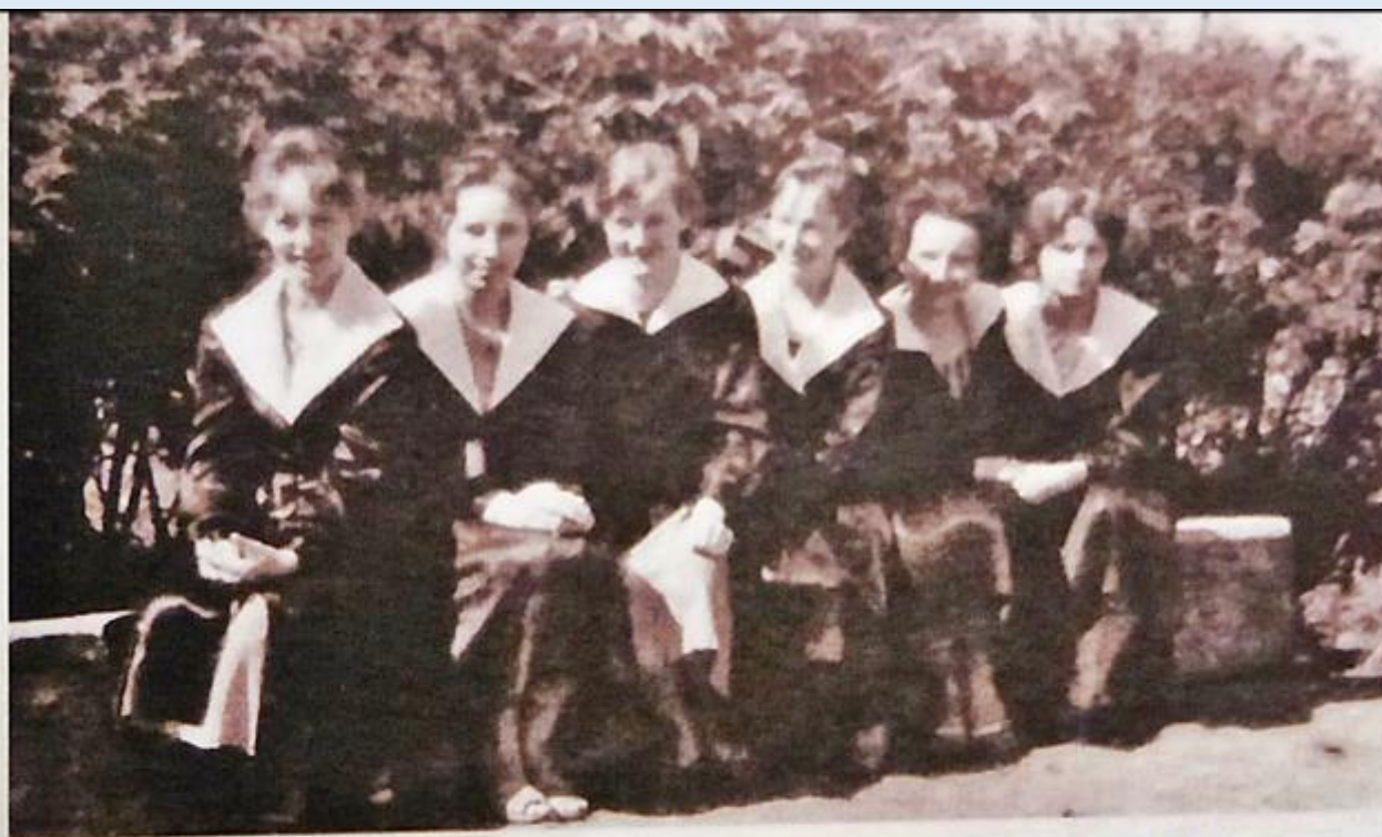
Uczennice Liceum Pedagogicznego w strojach szkolnych, 1958 r.