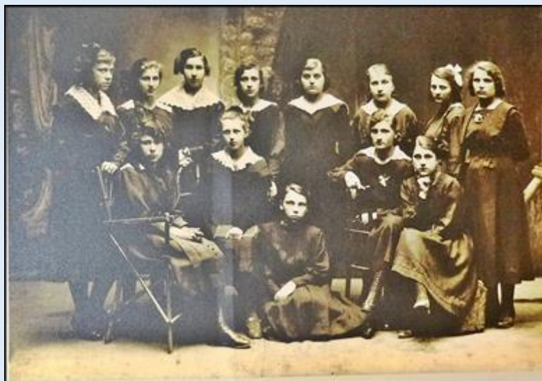
Uczennice VII klasy Gimnazjum Realnego Jadwigi Chomiczówny im. Jadwigi Królowej, ok. 1921