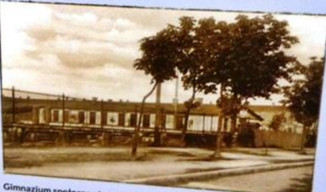
Gimnazjum społeczne im. F. Fabianiego, ul. Staszica, okres międzywojenny