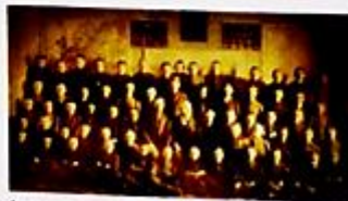
Grupa uczniów oraz dwóch nauczycieli szkoły F. Fabianiego, pocz. XX w.