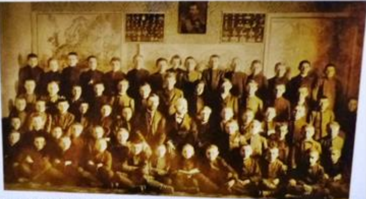
Grupa uczniów oraz dwóch nauczycieli szkoły F. Fabianiego, pocz. XX w.