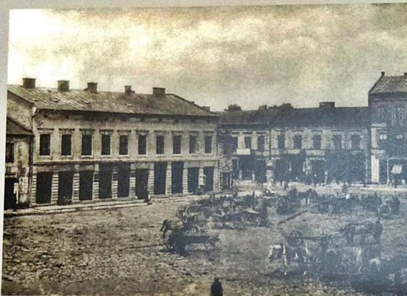
Rynek, budynek gimnazjum Jadwigi Chomiczówny