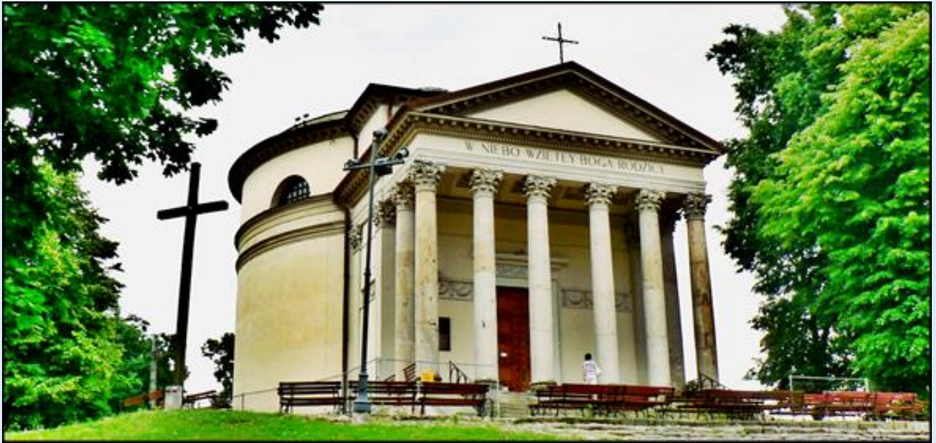
Kościół pw. Wniebowzięcia NMP