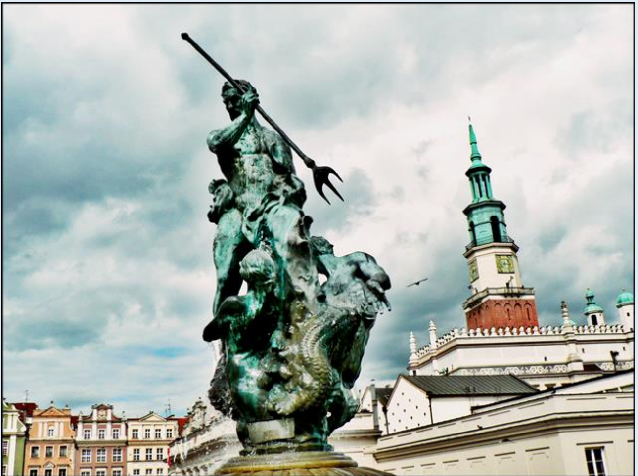
Rynek Starego Miasta