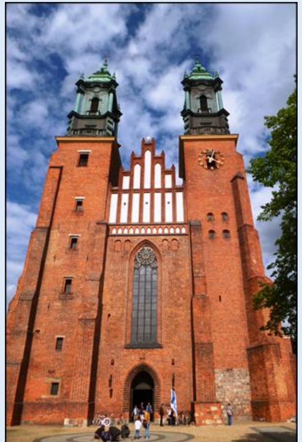
zob. Kościoły Poznania