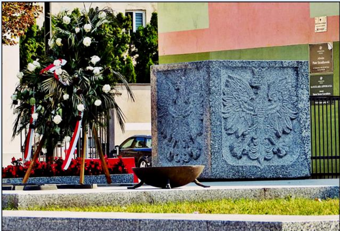
Pomnik Orłów przy PTTK